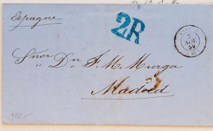
CARTA CON TEXTO IMPRESO DE NANTES, ANUNCIANDO AL VAPOR ESPAÑOL "BILBAO" Y SUS ESCALAS EN SANTANDER, BILBAO Y SAN SEBASTIAN.