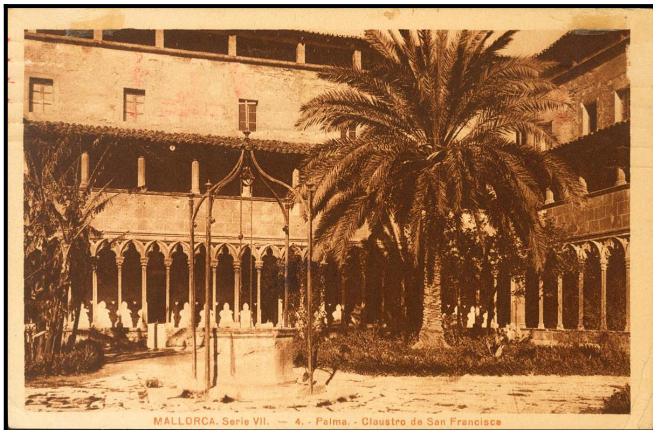
MALLORCA, Serie VII. — 4. - Palma. - Claustro de San Francisco