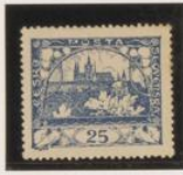
D. 13'75 x 13'5 35