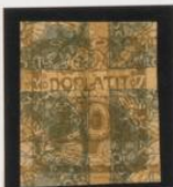
Bajo el 2h (n o 1) periódicas