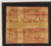
30h sobre 10h (n° 5)