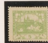
Verde D. 11'5 x 11