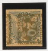
Sobre 20h. (nº 4) de fasas, acostado hacia derecha.