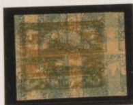
Doble impresión sobre el 2h (n° 1) de periódicos y sobre el 20h (n° 8)