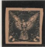
Triple impresión s/rosa