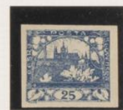
"S", palo horizontal corto