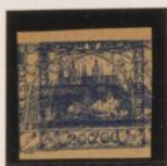
Doble impresión: azul y violeta