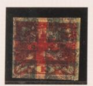
10h. triple impresión sobre 3h. (n° 2) y bajo 2h. (n° 1), doble impresión, de periódicos.