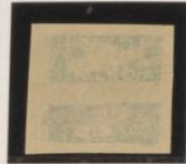
Calcado al dorso Doble, una invertida