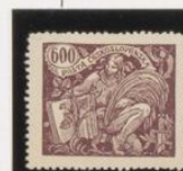
*Oro Castaño violeta