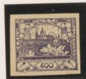
Doble marco interior y dcho.