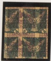
Doble impresion, sobre 50h (n°)