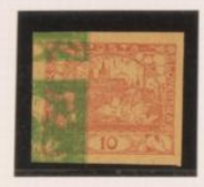
10h. rosa, bajo doble impresión de 5h. (n° 3)