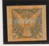
Sobre 60h. (nº 15) acostado