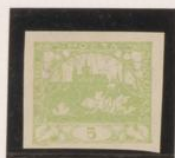
Verde claro papel blanco