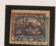
Sobre 20h. (n°8) Papel cartón crema