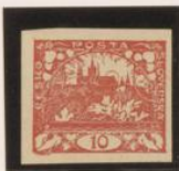
Sin marco Adornos entintados