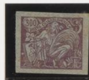
Lila rosa s/azul