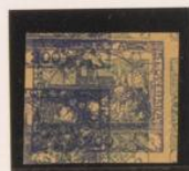
Doble impresión sobre 2h (n° 1), de periódicos.