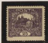
D. 13'75 x 11'5 Violeta oscura (no catalogada)