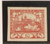
Rosa carmin Adornos superiores entintados