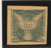
Doble impresión horiz.