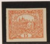
"1" (15), pie largo