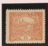
D. 11'5 x 14'25