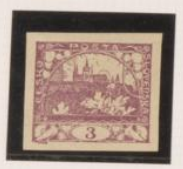
Papel blanco-bueso Color claro