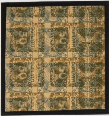
Bt. múltiple sobre 50h. (nº 1) de fasas, acostado hacia derecha.