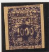
Sobre 50h (n o 15)