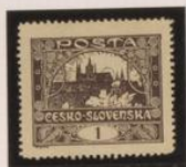
Salto de perfor.