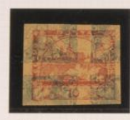
10h. bajo el 2h. (n° 3), invertido, de periódicos.