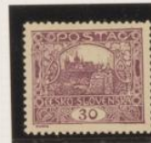
D. 11'75 37