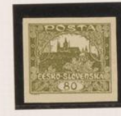
Falta línea inferior (marzo)