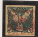
Doble impresion sobre 10h (n°5)