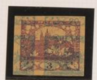
Sobre 20h. (n°8) Papel crema oscura