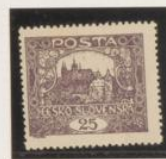
D. 13'75 x 13'5 36