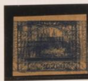
Triple impresión: azul gris y azul