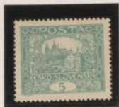
D. 13'75 x 13'5 29