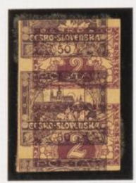
Pareja retrechta. 50h (n.º 18) sobre 2h. expres