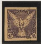
Doble impresión sobre margen sello de tasa