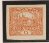
"1" (15), círculo blanco