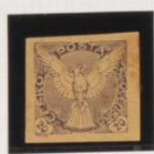
Violeta sobre crema