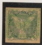
Sobre 5h (n°3) invertido, coincidente