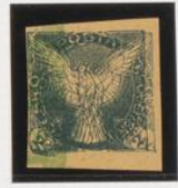
Doble impresión sobre 5h.