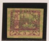
Sobre 3h. (n°3) Papel crema clara