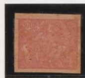
Rosa-rojo s/rosa salmón