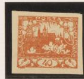
"O" de "40", voido a marco