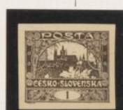
Sol casi imperceptible