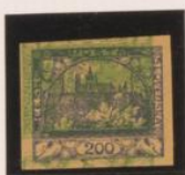
Doble impresión del 5k. (n° 3) sobre 200h.