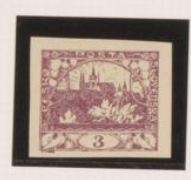
P. blanco-bueso Color medio