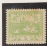
D. 11'5 28