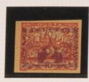
10h. bajo el 2h. (n° 3) de periódicos.