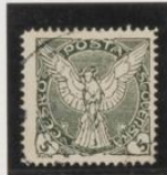
Verde-negro dent. 11's