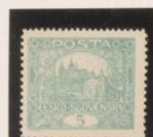
D. 13'15 x 11'5