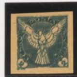
Triple impresión, una en verde claro