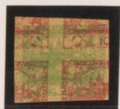
Doble impresión sobre 10h (m° 5) Papel-cartón crema