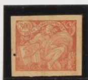
Rojo s/crema claro