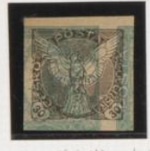
Sobre 5h (n.º 4) acostado