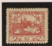
Línea de envuadre