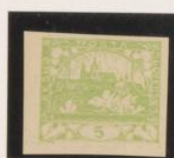
Impresión estingada "N" rota 3a