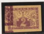
Cuádruple impresión, tres, invertidas