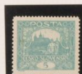
D. 13'15 x 11'5