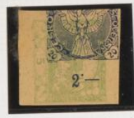
Azul sobre 5h (n.º 3) acostado