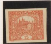
"1" (15), cabeza y pie, Triangulares