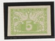
"U", en vez de "O"