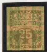
Sobre doble impresión del 5h (n o 3)