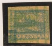
Doble impresión sobre 5h. (n° 3)