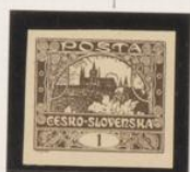
Sol muy marcado