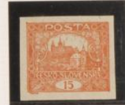
"1" (15), Pie triangular