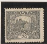
D. 11 Gris plata no catalog.