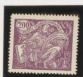
Verde Violeta castaño