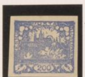
Doble marco y entintado Doble s.o.