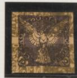
Doble impresión bajo 40h. (n°7) de tasa. (Calado al dorso)