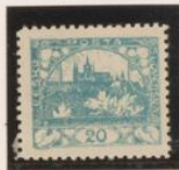
D. 10'5 Marco rojo