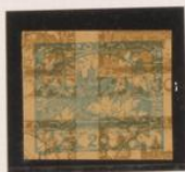
20h sobre 30h. (n° 12)