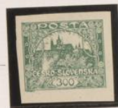
Falla tinta en vegetación