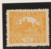
D. 13'75 x 13'5 38