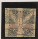
Sobre 2h. (n°1) interfilado