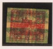
10h. doble impresión sobre 5h. (n° 3), y bajo 2h. (n° 3), de periódicos.