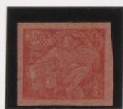
Rojo s/rosa oscuro