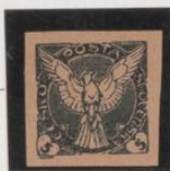
Doble impresión, s/rosa "C" → "U"