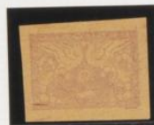
Calco al dorso