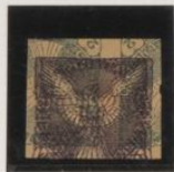
Doble impresión bajo 2h. (n°1), interfilado