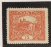
D. 13'75 32