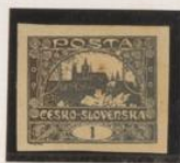
Oris castaño (gema original)