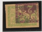
Bajo Rb. (nº 3)