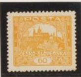
Óvalo roto D. 11'75