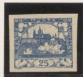
"P", palo vertical corto