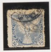
Dent. 11/5 (irregular)