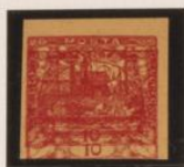
Vertical P. derecha