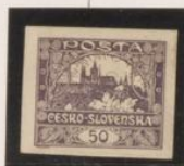
Línea completa sobre "0"