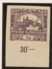
Borde de hoja