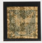
Sobre 50h. (nº 8) de fasas, acostado h. izquierda