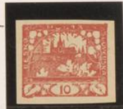
Sin marco Falta parte de "POSTA" "N" nota