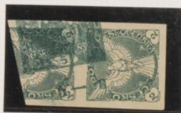
5h (n°4) bande de hoja sobre 2h. (papel blanco)