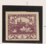
P. gris poroso Color intenso *a" y "b", rotas