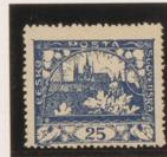
D. 13'75 x 13'25