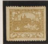
D. 11'5 x 0 sin catalogar