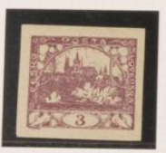
Papel amarillento Color claro-medio