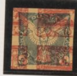
Sobre 10h (n°5)