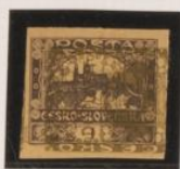
Sobre 5h (m.1) de lasas