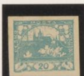
Entintada. "N", rota