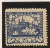
D. 11'5 Retira marco