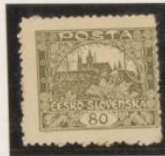
D. 11'5 sin catalogar