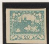
Entintada: ademós "P" rota "O", con pico (POSTA) "Q" en vez de "O"