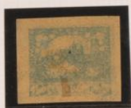
Calcado al dorso