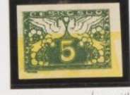
Verde oscuro y amarillo Cartulina - couché