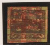
Impresión sobre 10h (m:2) invertida y sobre 5h (m:3) acostada.