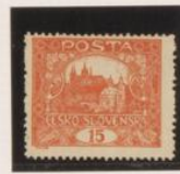
D. 13'75 Marco rojo