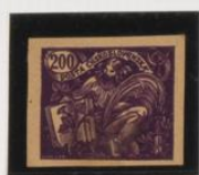
Violeta oscuro/crema claro