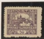
D. 11'5 sin catalogar