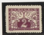
Dent. 11,25x11,5 No catalog.