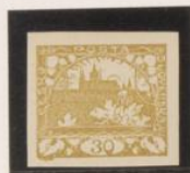
Marcas inferiores entintadas