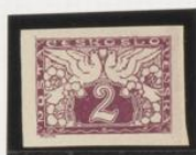
Estofado marco interior