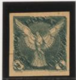
Triple impresión, una en verde