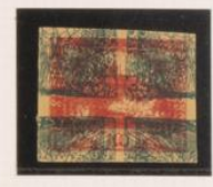
10h. doble impresión, bajo 2h. (n° 1), doble impresión, de periódicos.