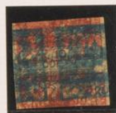
Doble impresión sobre 10h (n° 5) y 10sh (n° 20), invertido.