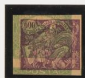
Rosa-lila s/106 (m:6)