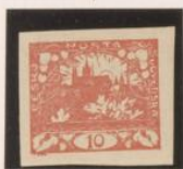
Sin marco exterior Adornos entintados "S" nota