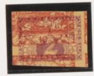
10h (n.º 5) sobre 2h. expres