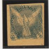
Doble impresión vertical