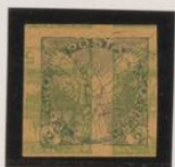
Sobre 5h (n°3) invertido