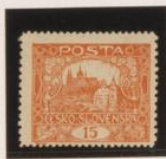
D. 13'75 x 11'5