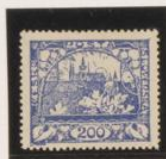
D. 13'75 x 13'5 40