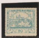
D. 13'75 33