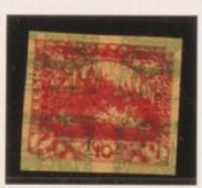
10h. triple impresión, bajo 5h. (n° 3)