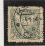
Dent. 11's (Verde)