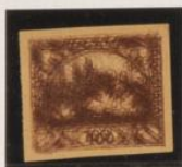
Triple impresión Papel crepe