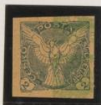
Sobre 5h. (n°3)