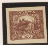
5ª parte al óvalo