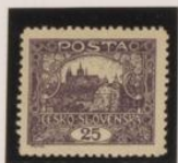
D. 31'5 x 40'75

1918/20 Castillo de Praga: n.ºs 26, 37, 38, 39 y 40