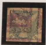
Sobre 3h. (n°2)