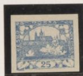
"P", palo vertical corto