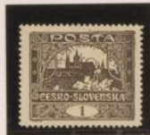
Doble marco esquina deha.