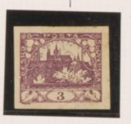
P. amarillento Color intenso Marco rojo y "T" sin base.