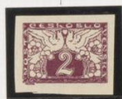
"L" en vez de "K"