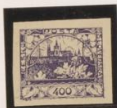
Doble marco parcial