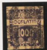
Sobre 1h (n o 1) ajustado