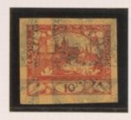
10h. rojo, bajo el 2h. (n° 1), de periódicos.