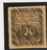
Doble impresión s/5h.