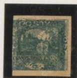
Sobre 5h. (n°4)