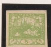
Impresión estingada "N" rota 3a