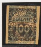
Sobre 2h (n o 1) periódicas