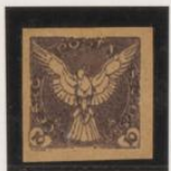
Doble impresión sobre papel-cartolina crema