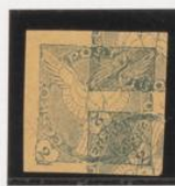
Doble impresión, 1 acost.