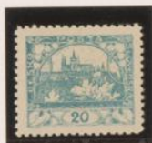
D. 10'5 Marco rojo