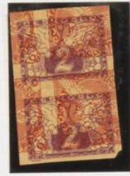
Pareja acostada. Sobre 6h. (n.º 3) periódicos