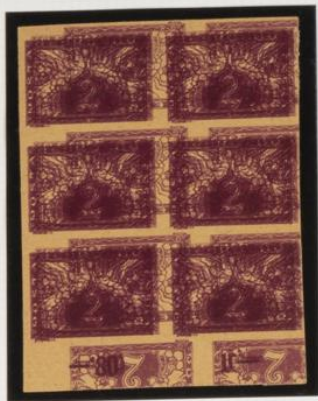
Triple impresión, 2, bordes de hoja, y una, invertida