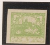
Verde papel poroso