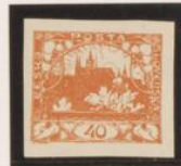
Rotura marco superior