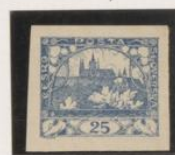
"T", palo vertical roto