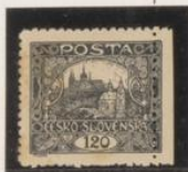
D. 11'5 Dent. desplazado