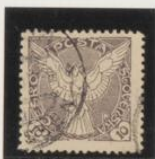
Dent. 11/5 x 11/25