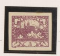
P. blanco-bueso Impresión entintada *N° rota, fallan adornos