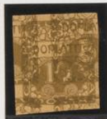
Sobre 5h (n o 1)