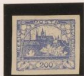
Doble marco parcial