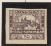
Rotura entre "0" y "5"