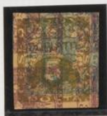
Sobre 20h (n o 8) y 3h (n o 2) sobre ambos