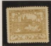
D. 18'25 x 14'75 x 12'5 = 16 sin catalogar