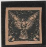
Doble impresión s/rosa