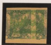
Doble impresión bajo 2h (m° 1) de periódicos Papel crema