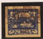
Doble impresión sobre 100h. (n° 20)