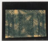
Cuadruple impresión, 2 invert.