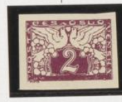
Falta "K", Marco inf. estofado