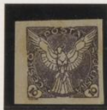
Sobre papel verde