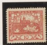
D. 11'5 36