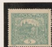
D. 13'75 Marco roto