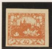
"L", palo corto