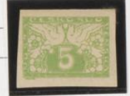
"U", en vez de "O"