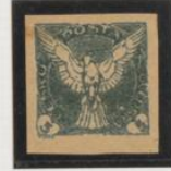
Doble impresión, 009 verde claro