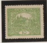
D. 13'75 x 13'5 31