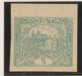
Papel fino hueso Doble marco superior