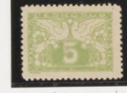
Dent 11's No catalog-