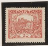
D. 13'75 x 13'5 34