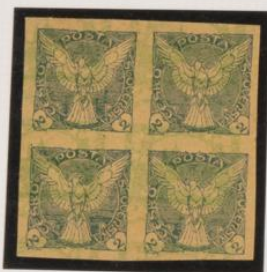
2x2. Sobre 5h (n°3)