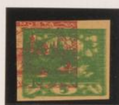
Triple impresión sobre 10h (m° 5) Papel crema