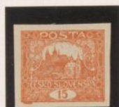
"1" (15), sin pie