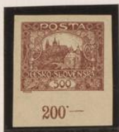
Borde inferior de hoja Punto sobre '5' y óvalo.