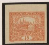
Cabeza del "1" (15) curva, Pie corto