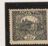
D. 11'5 39