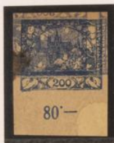
Impresión azul, borde de beige sobre impresión azul-gris, invertida