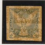
Sobre 30h. (nº 12) invertido