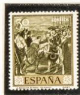
"La Rendición de Breda"