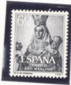
Nuestra Señora de Covadonga