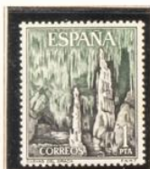
3 - Mallorca (16/3)