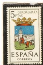
21 — Guadalajara