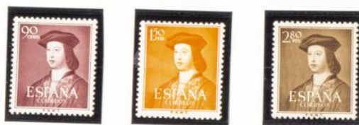
Retrato de Fernando el Católico (1452-1516)