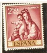
"La Virgen de la Gracia"