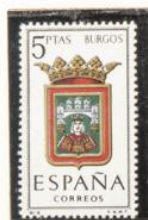
9 — Burgos