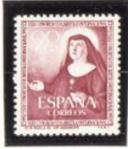
"Santa María Micaela"

XXXV Congreso Eucarístico Internacional en Barcelona