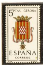
18 — Gerona