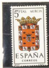
33 — Murcia