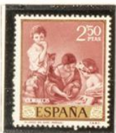
"Juego del Dado"