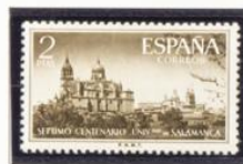
Catedral de Salamanca