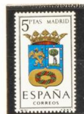
31 — Madrid