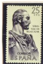
Sebastián de Belalcázar