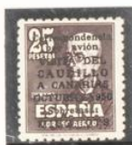
Manuel de Falla (1876-1946)