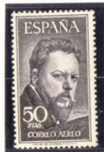
Joaquín Sorolla y Bastida (1863-1923)

VII Centenario de la Universidad de Salamanca