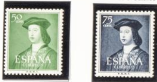
V Centenario del Nacimiento de Fernando el Católico