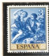
"Niños comiendo pasta"