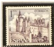
1 - Segovia (8/1)