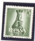
Nuestra Señora de Espartero