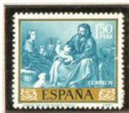
"Sagrada Familia del Pejante"