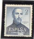
San Francisco Javier (1506-1552)