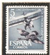
"Caza de la Avutarda"