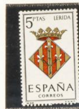
28 — Lérica