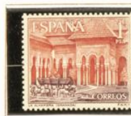
2 - Granada (10/2)