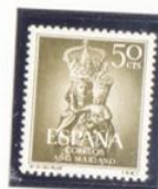
Nuestra Señora del Pilar