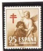
"Tobias y el Angel"