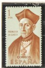
Pedro de la Gasca