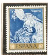
"Entierro del Conde de Orgaz"