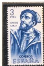
Juan de Garay