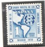
Mapa de América