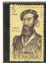
Cabeza de Vaca