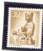
Nuestra Señora de Montserrat