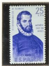
Menéndez de Avilés