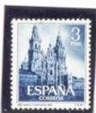
Catedral de Santiago de Compostela