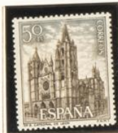
8 - León (26/10)