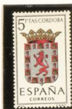
14 — Córdoba