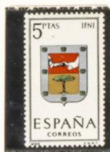
25 — Iñi