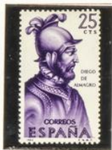
Diego de Almagro