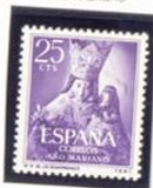
Nuestra Señora de los Desamparados