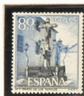
7 - Córdoba (27/9)