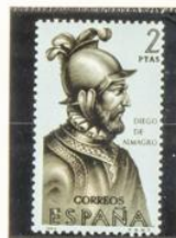
Diego de Almagro