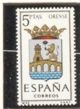
35 — Orense