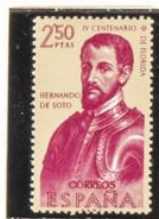
Hernando de Soto