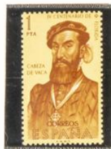
Cabeza de Vaca