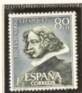
"Estatua de Velázquez"