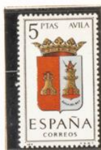
5 — Avila