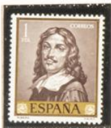
"Retrato de Ribera"