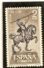
Estatua ecuestre en Sevilla