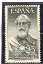
Miguel López de Legazpi (1510-1572)