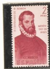
Menéndez de Avilés