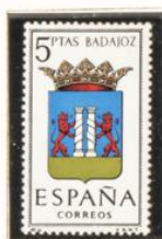
6 — Badajoz