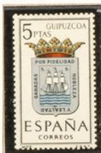
22 — Guipúzcoa