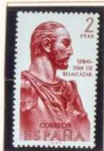
Sebastián de Belalcázar