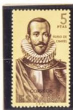
Núño de Chaves