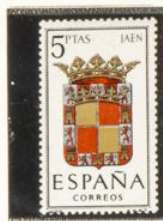
26 — Jaén