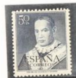
San Antonio María Claret (1808-1870)