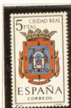
13 — Ciudad Real