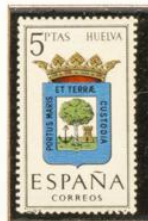
23 — Huelva