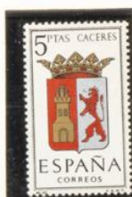
10 — Cáceres