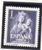
Nuestra Señora de la Almudena