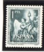
"La Eucaristía" - Trípulo