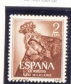
Nuestra Señora de Africa