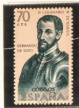
Hernando de Soto