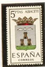
2 — Albacete