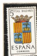
7 — Baleares