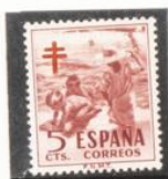
"Niños en la Playa", Sorolla