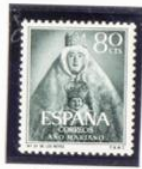
Nuestra Señora de los Reyes