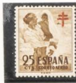
"Después del baño", Sorolla