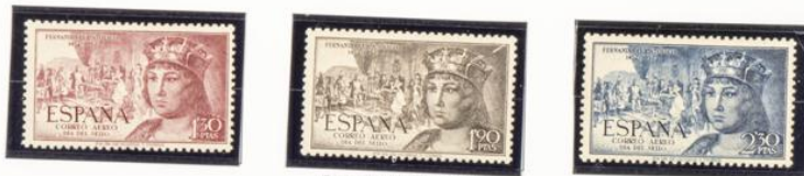
Retrato de Fernando el Católico. J.A. Morales y "Recepción en Barcelona", Ricardo Balaca