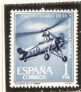
Autogiro "La Cierve"