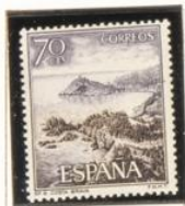
9 - Tossa Costa Brava (30/11)