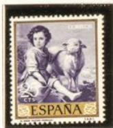
"El Buen Pastor"