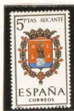
3 — Alicante