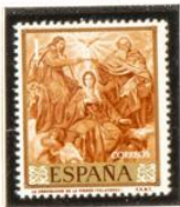
"La Coronación de la Virgen"