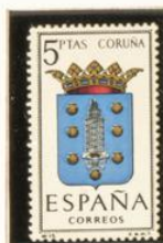
15 — Coruña