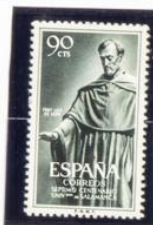
Fray Luis de León (1527-1591)