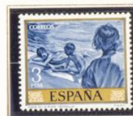
"Niños en la playa"