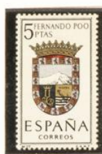
17 — Fernando Poo