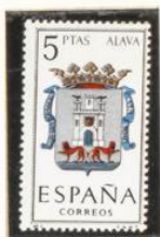
1 — Alava