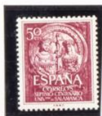
Los Reyes Catolicos Escultura de la Fachada de la Universidad

VII Centenario de la Universidad de Salamanca