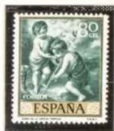
"Niños de la Concha"