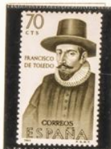
Francisco de Toledo