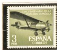
Avión "Jesús del Gran Poder"