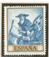
"Apoteosis de Santo Tomás de Aquino"