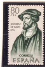
Rodrigo de Bastidas