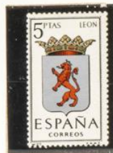
27 — León