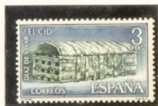
Cofre del Cid