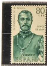
Ponce de León