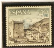
10 - Potes - Santander (14/12)