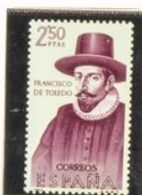
Francisco de Toledo