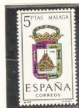
32 — Málaga