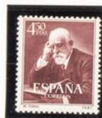
Jaime Ferrán y Cúa (1852-1929)