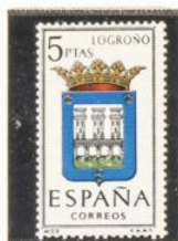
29 — Logroño