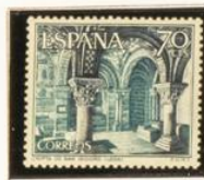
5 - León (22/6)