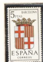
8 — Barcelona