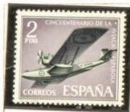
Hidroavión "Plus Ultra"