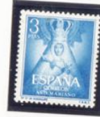
Nuestra Señora de Guadalupe