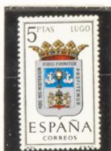
30 — Lugo