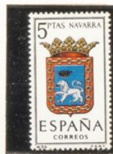
34 — Navarra