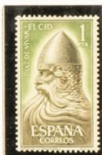
Busto de la estatua del Cid