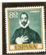
"Caballero de la mano al pecho"