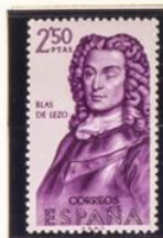
Blas de Lezo