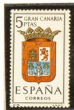
19 — Gran Canaria