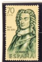
Blas de Lezo