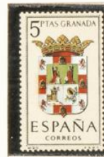
20 — Granada