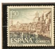
6 - Gerona (27/7)