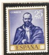
"Triunfo de Baco"