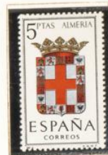
4 — Almería