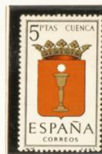
16 — Cuenca