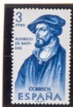
Rodrigo de Bastidas