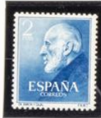
Santiago Ramón y Cajal (1852-1934)