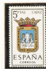
11 — Cádiz