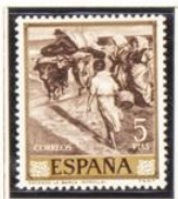
"Sacando la barca"