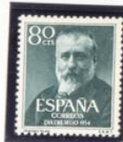
Marcelino Menéndez y Pelayo (1856-1912)