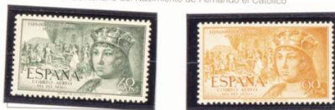
V Centenario del Nacimiento de Fernando el Católico