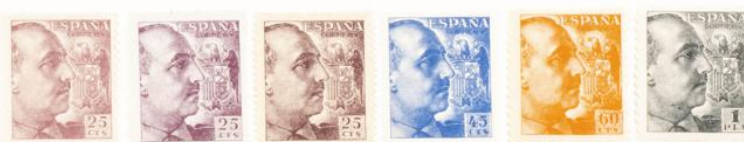
(Lugar 13 del bloque reporte)