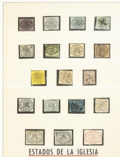
ESTADOS DE LA IGLESIA