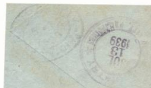
Censura militar Santa Cruz de Tenerife (2)