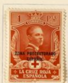
Príncipe de Asturias