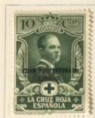
Príncipe de Asturias