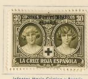
Infantes María Cristina y Beatriz