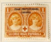
Infantes María Cristina y Beatriz

1926.—Sellos de España del mismo año conmemorativos de la Cruz Roja habilitados ZONA PROTECTORADO ESPAÑOL