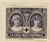
Infantes María Cristina y Beatriz