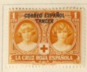
Infantes Maria Cristina y Beatriz

1926.—Sellos de España del mismo año conmemorativos de la Cruz Roja habilitados CORREO ESPAÑOL TANGER