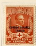
Príncipe de Asturias