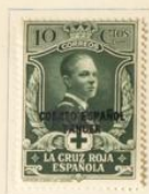
Príncipe de Asturias