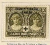
Infantes Maria Cristina y Beatriz