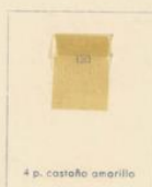
4 p. castaño amarilla