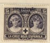
Infantes Maria Cristina y Beatriz