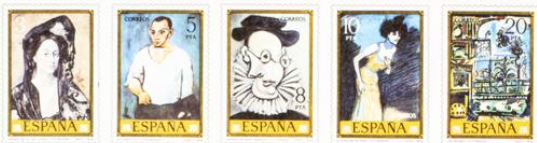
Fecha de emisión: 29 de septiembre de 1978