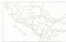
MAPA DE LAS RUTAS DE LOS CORREOS MARÍTIMOS DEL ESTADO ALREDEDOR DE 1776

En los primeros tiempos las comunicaciones postales entre España y sus colonias de América fueron muy escasas y servidas por los Correos Mayores, se limitaban a los documentos oficiales y a los de un carácter notarial y personal, aprovechando las travesías de los buques que cruzando el océano, transportaban en uno y otro sentido, mercancías, tropas, colonos y en uno y a la par, encomendados en las costas de las Américas.