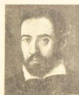
13. Retrato de Juan de Juanes. Siglo XVI. Museo de San Juan de los Rios.

La introducción del arte italiano en Valencia tiene un carácter particular. Juan de Juanes, nacido en Valencia en 1523, es un pintor que representa un tipo de arte que se desarrolla en un momento de gran actividad y por haber sido pintado por un artista que alcanzó la fama y el reconocimiento de su época. En el siglo XVI, la pintura española se desarrolla en un ambiente de gran actividad y por haber sido pintado por un artista que alcanzó la fama y el reconocimiento de su época.