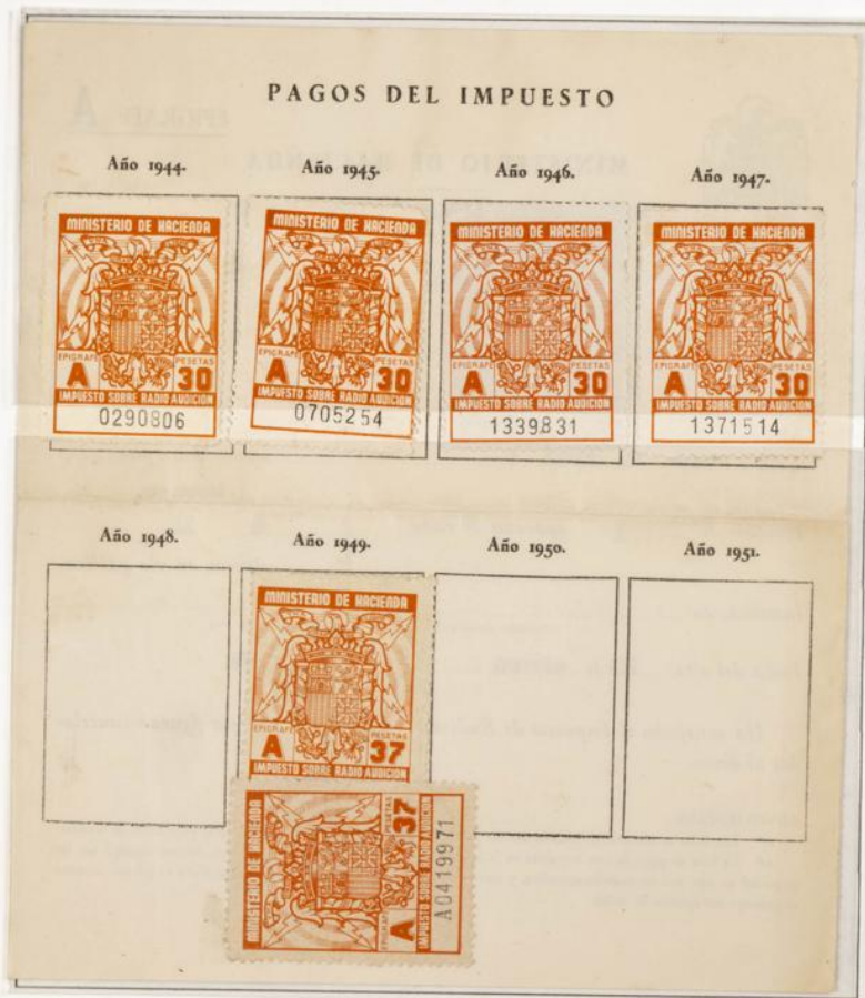
Impuesto sobre la Radioaudición. Documento fechado el 20 de Enero de 1944. Contiene cuatro sellos de 30 Ptas años 1944 al 1947 y dos de 37 Ptas correspondientes al año 1949 y al pago no satisfecho de 1948. En el dorso del sello correspondiente a 1948 figura la fecha escrita a mano.