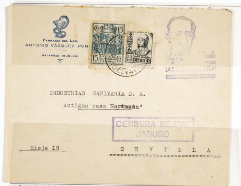
Carta circulada desde Cazorta Huelva a Sevilla. Matasellos de salida con fecha ilegible y llegada a Sevilla en Marzo de 1938. Censura militar de Jabugo. Sello fiscal especial facturas y recibos de 15 cts verde.

1937.- Timbre para facturas. Escudo con corona mural. Impreso en Litografía. Pie de imprenta "HIJOS DE H. FOURNIER VITORIA." Dentado 10 ¼ - 11 ½.