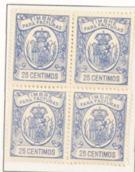
Dentado 11 ½