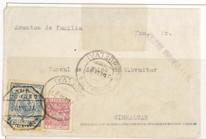
Sobre circulado de Huelva a Gibraltar. Matasellos ambulante nº 1 de Sevilla a Huelva de fecha 25 de Enero 1937, matasello de La Palma ( Sevilla) .Pórtiza de 25 cts azul y Telégrafos 25 cts. Al dorso matasello de llegada a Gibraltar del 28 de Enero de 1937.

1920 -1936.- Timbre para facturas. Escudo con Corona Real . Numeración en el reverso. Dentado 13 ½. De peine.