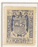
1 \times 3/4