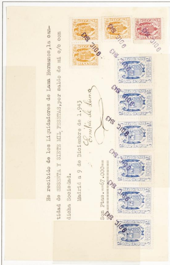
Recibo de fecha 9 de Diciembre de 1943, por importe de 67.000 Pts con 6 Especial para Facturas y recibos de 5 Pts color Azul, dos especiales moviles sin pie de imprenta de 60 cts y un especial Movil sin pie de imprenta de 30 cts.

1939.- Timbre para facturas y recibos. Escudo Nacional. Impreso en litografía. Dentado 10 1/2 en peine.