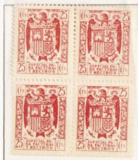
1 \times 3/4