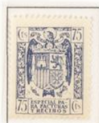
1 \times 3/4