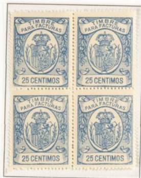
Dentado 13 ½

Se llo para facturas y recibos. Corona Real en un óvalo. Leyenda Timbre para facturas en la parte superior y valor en la inferior. En los laterales corona de laureles. en rojo. Dentado 13 ½