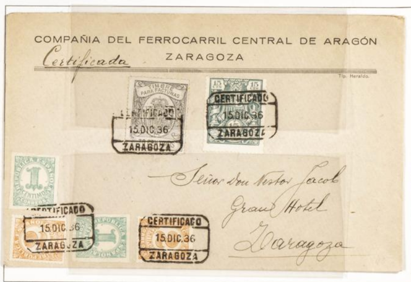
Sobre certificado circulado correo interior Zaragoza. Matasellos de salida Zaragoza fechado el 15 Diciembre 1936. Timbre para facturas negro 30 cts y 15 cts verde especial para facturas y recibos

1920 -1936.- Timbre para facturas. Escudo con Corona Real . Numeración en el reverso. Dentado 13 1/2. De peine.