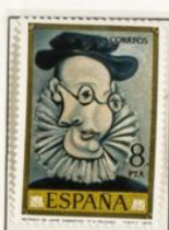
Retrato de Jaime Sabartés