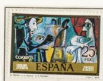
El pintor y la modelo

Album Cultural Torres (patentado) Apartado 219 - VILLENA - Lámina n.º 151.D