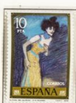
El final del número