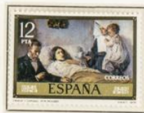
Ciencia y Caridad