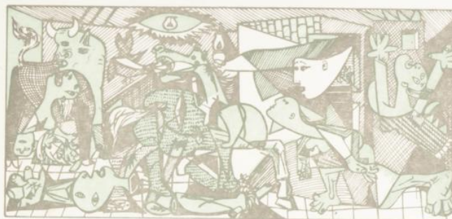
"GUERNICA" - 1937 MUSEO NACIONAL DE ARTE MODERNO NUEVA YORK

Fecha emisión: 29 septiembre 1978 Tirada: 10.000.000