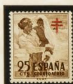
CUADROS DEL PINTOR SOROLLA