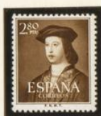
FERNANDO EL CATOLICO. 1492 - 1516