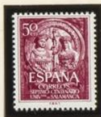
LOS REYES CATOLICOS FACHADA DE LA UNIVERSIDAD