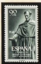
FRAY LUIS DE LEON