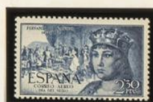
COLON ANTE LOS REYES CATOLICOS A SU REGRESO DE AMERICA