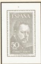
MIGUEL LOPEZ DE LEGAZPI