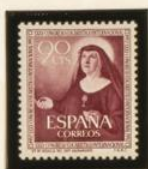
SANTA MARIA MICAELA