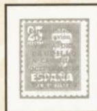
SELLOS DE 1948. CAUILLLO Y CASTILLO DE LA MOTA. SOBRECARGADOS