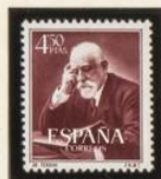
JAIMÉ FERRÁN Y CLUA