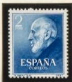
SANTIAGO RAMON Y CAJAL