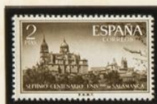
CATEDRAL DE SALAMANCA