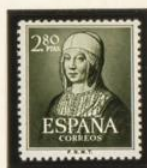
ISABEL LA CATOLICA 1451 - 1504