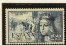
RENDICION DE GRANADA