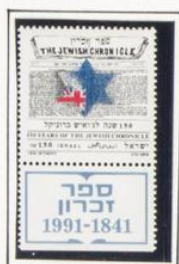
1951. 150º aniversario de «The Jewish Chronicle»