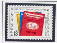
1988. Revista «Problemas de la paz». 30 aniversario