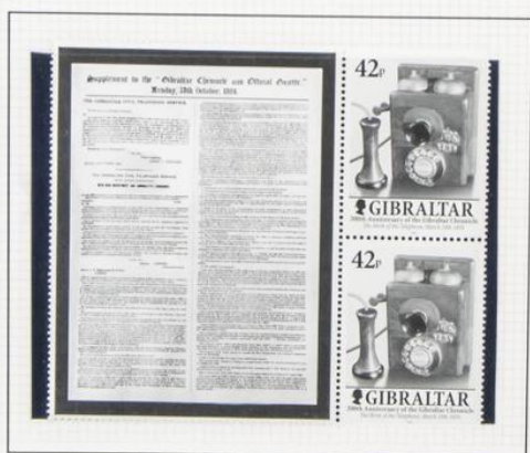
Nacimiento del teléfono, 1876