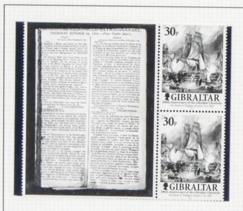
Batalla de Trafalgar, 1805

2001. Bicentenario del diario «Gibraltar Chronicle». Sellos alusivos a acontecimientos importantes y viñetas de las primeras páginas de los números de esos días