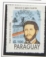
1991. Natalicio de María Talavera, primer cronista de guerra