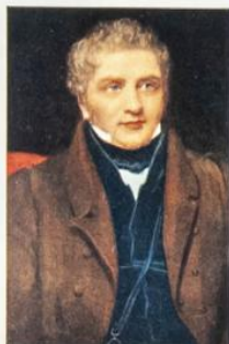
John Walter II was the founding father of the role of the press as a fourth estate of the realm. His great editor was the young Thomas Barnes. The Lord Chancellor said: "Barnes is the most powerful man in the country"