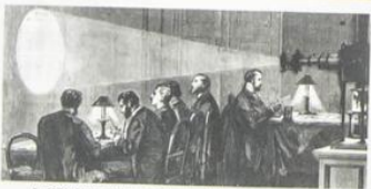
In 1870 during the Franco-Prussian War, the Siege of Paris cut communications for The Times. Above: dispatches and personal advertisements for the Agency Column were flown out by balloons. Below: microscopically reduced messages were carried in and out by pigeons, and magnified by electric light