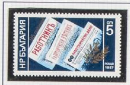
1987. Aniversario de los periódicos «Rabotnichko Delo», «Pravda» y «Trud»