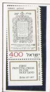
1977. Cuarto centenario del primer periódico israelí impreso en Tierra Santa