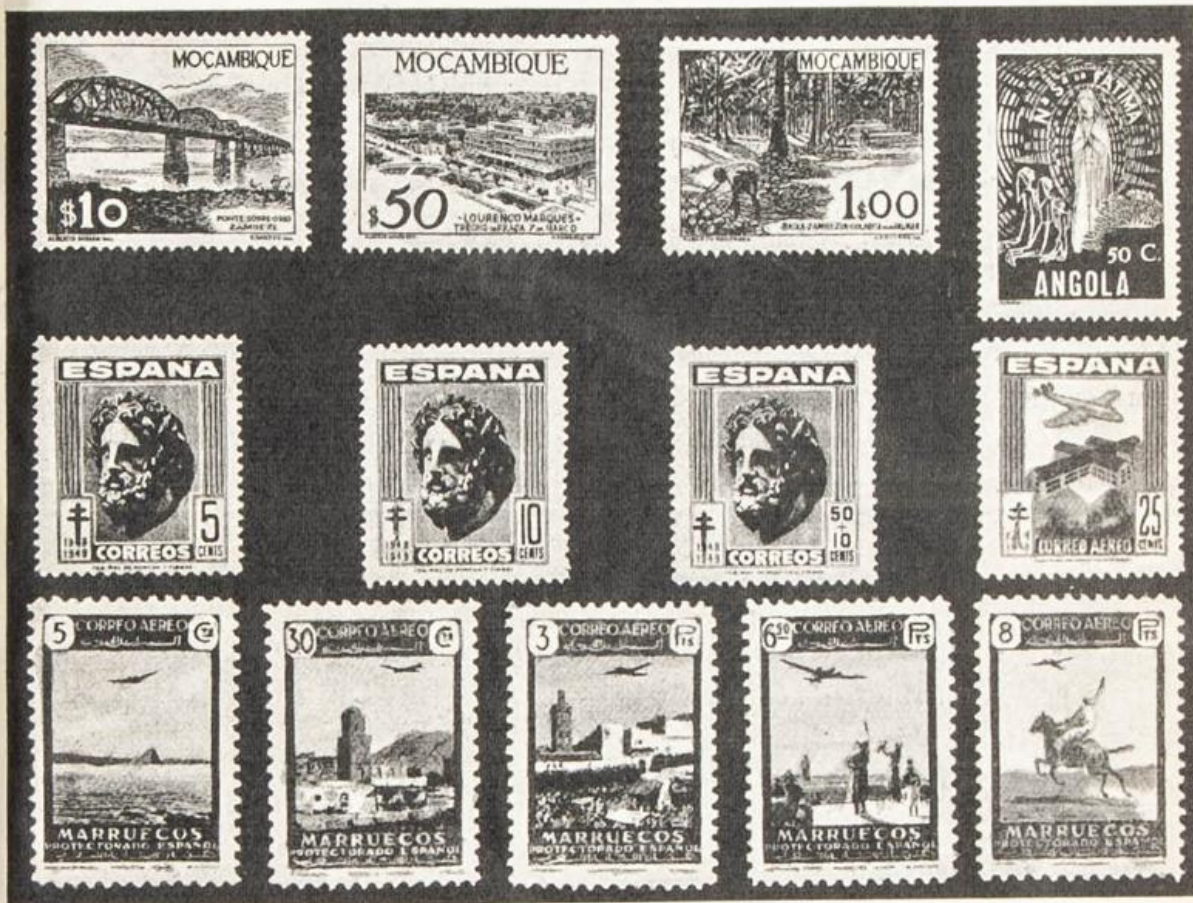
Ultimas emisiones de Colonias Portuguesas, España y Marruecos