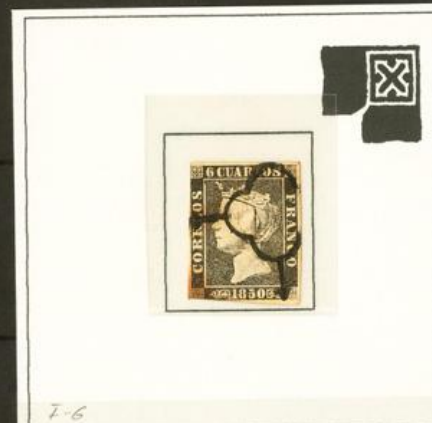
I-6 Raya Defecto de impresión. Mancha blanca entre el marco y la roseta superior derecha