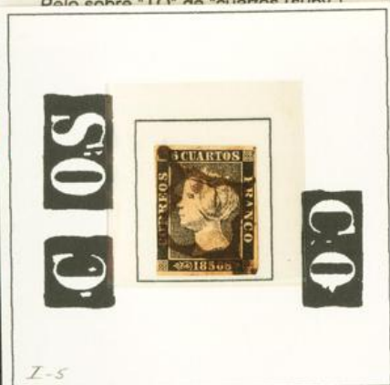
I-5 Defecto de impresión. Mancha blanca a los lados de la "C" de "correos". Manchas blancas entre "O" y "S" de "correos". Manchas blancas entre "C" y "O" de "franco". Deformación de "O" de "franco".