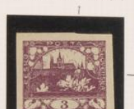
P. gris poroso Color intenso *a" y "b", rotas