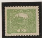
D. 13'75 x 13'5 31