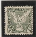
Verde-negro dent. 11's