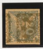
Sobre 20h. (nº 4) de fasas, acostado hacia derecha.