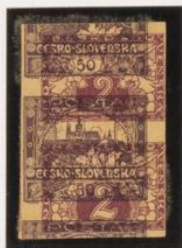
Pareja retrechta. 50h (n.º 18) sobre 2h. expres