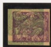
Rosa-lila s/106 (m:6)