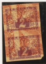
Pareja acostada Sobre 6h. (n.º 3) periódicos