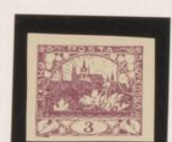
P. blanco-bueso Color medio