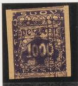
Sobre 5 h. (n o 1)