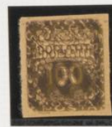
Doble impresión s/5 h.