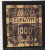
Sobre 1 h. (n o 1) ajustado