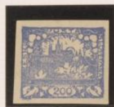
Doble marco y entintado Doble s.o.