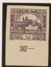
Borde de hoja