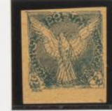
Doble impresión vertical