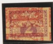
10h (n.º 5) sobre 2h. expres