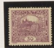
D. 11'75 37