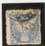
Dent. 11/5 (irregular)