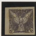
Sobre papel verde