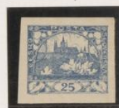
"T", palo vertical roto