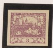
Papel blanco-bueso Color claro