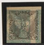
Sobre 5h (n.º 4) acostado