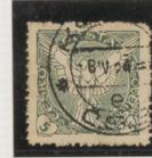
Dent. 11's (Verde)