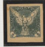
Doble impresión, 009 verde claro