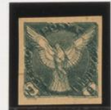
Triple impresión, una en verde