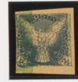
Doble impresión sobre 5h.