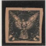
Triple impresión s/rosa