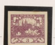
P. blanco-bueso Impresión entintada *N° rota, follen adornos