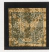
Sobre 50h. (nº 8) de fasas, acostado h. izquierda