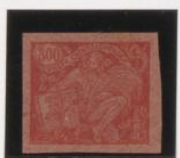
Rojo s/rosa oscuro