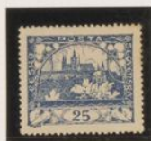
D. 13'75 x 13'5 35