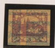
Sobre 20h. (n° 8) Papel crema oscura