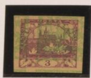
Sobre 3h. (n° 3) Papel crema clara