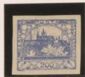
Doble marco parcial