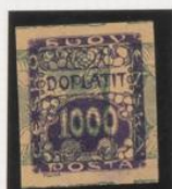
Sobre 2 h. (n o 1) periódicas