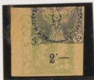
Azul sobre 5h (n.º 3) acostado