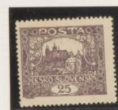
D. 13'75 x 13'5 36