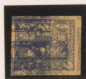
Doble impresión sobre 2h (n° 1), de periódicos.