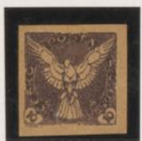
Doble impresión sobre papel-cartolina crema