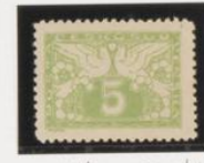
Dent 11's No catalog-