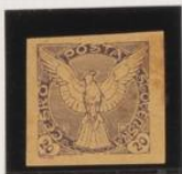
Violeta sobre crema