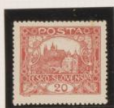
D. 13'75 x 13'5 34