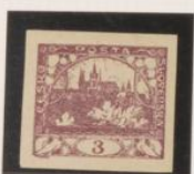
Papel amarillento Color claro-medio