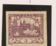
P. amarillento Color intenso Marco rojo y "T" sin base.