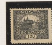
D. 11'5 39