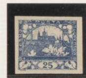
"S", palo horizontal corto