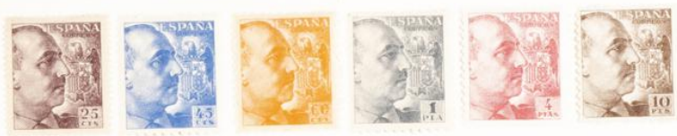
(Lugar 24 del bloque reporte)