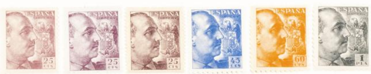
(Lugar 13 del bloque reporte)