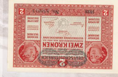
2 Coronas, Imperio Austro-Húngaro 1917.

La guerra también aportó intrínsecamente inteligencia militar y propaganda política a la rica vida intelectual y social de Alemania. Desde Inglaterra llegaron sigilosamente varias Germanías impresas en Wallford, cerca de Londres, con la misión de colarse en los hogares de news headlines cartas con propaganda y la situación real sobre el desarrollo de la guerra, que contradecía la información oficial que el gobierno alemán daba a su gente. Con este fin se usaba el correo aéreo. Estos sellos eran impresos en Inglaterra por el servicio secreto inglés, pero obviamente se necesitaban miles y salían mucho más baratos que correspondientes sellos locales. Por otro parte, sellos de Alemania significaba entregarle recursos económicos al enemigo.