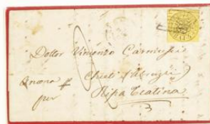
Carta de un pliego franqueada con el sello de 4 baj, de la emisión de 1852

Las tarifas postales se establecieron, en principio, en función del número de pliegos enviados y de la "distancia". Y así quedó establecida la tasa de porte de 1 baj, para cartas de un pliego dentro de una misma circunscripción; de 2 baj, para las de circunscripciones postales limitrofes; de 3 baj, para las de circunscripciones postales no limitrofes pero de la misma "distancia"; de 4 baj, las de "distancias" contiguas, y de 5 baj, las de "distancias" no contiguas. Las cartas certificadas se gravaban, a su vez, con otra tasa igual a la utilizada en el franqueo.