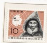
1960 - L Aniversario de la expedición a la Antártida por el teniente Shirase