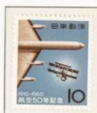
1960 - I Aniversario de la aviación nacional