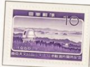
1960 - Inauguración del observatorio de Okayama