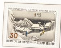
1960 - Semana internacional de la carta