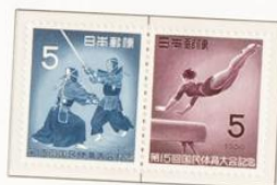
1960 - XV Reunión atlética nacional