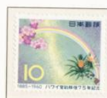
1960 - LXXV Aniversario de la emigración a las Hawaii