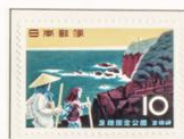
1960 - Parque nacional de Ashizuri