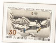
1960 - Semana internacional de la carta