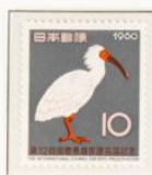
1960 - XII Congreso internacional para la protección de las aves