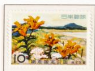
1960 - Parque nacional de Abashiri