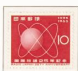
1960 - XXV Aniversario de Radio Japón