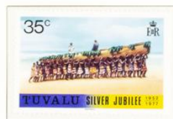
Der Herzog von Edinburgh im Staatskannu, getragen von Eingeborenen, bei seinem Besuch auf der Insel Tuvalu.