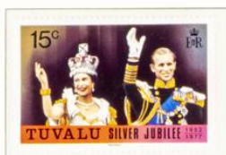
Königin Elisabeth II. und der Herzog von Edinburgh auf dem Balkon vom Buckingham-Palast nach der Krönung.

Kronkolonie im Stillen Ozean, ehem. Ellice-Inseln, seit 1976 von Gilbert-Inselgruppe unabhängig; Hauptort: Funafuti; 10 000 Einw.; Wäbrg.: 1 Austr.-Dollar = 100 Cents.