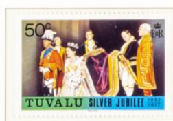
Die Königin bei der Krönung.