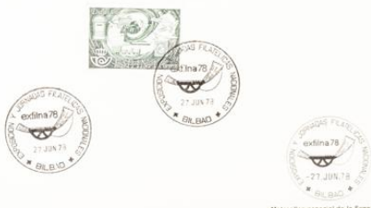
Matavillos especial de la Exposición y Jornadas Filatélicas Nacionales Exfina 78

N o es extraño que el mundo entero se haya interesado en el correo español, sobre el cual figura el nombre del correo que ha de recoger toda carta postal que llegue a su destino en el campo, emergiendo del fondo del campo, una representación de los medios utilizados a través de los siglos para el envío postal: el mensajero de los faraones, el correo a caballo, el alcarán, el galeón, el ferrocarril, el barco y, al fin, el avión, y una línea de la red postal, la carta y el sello, en el extremo superior de la emisión. En la parte superior izquierda, una representación que simboliza la comunicación y entendimiento a través del correo de todos los pueblos y razas del mundo.