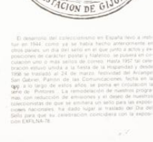
Matavillos especial de la Exposición y Jornadas Filatélicas Nacionales Exfina 78

El mundo del correo se complementa con el espacio de la Dirección y otros organismos que sirven a sus clientes. Descripción general para servir a todos sus clientes. Descripción general para servir a todos sus clientes. Descripción general para servir a todos sus clientes.