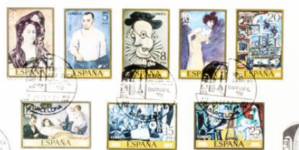
Matavillos especial de Barnat6 78

Tamaño entre los ejes de perforación: 38,9 x 40,9 mm para los valores de 5, 8, 10 y 20 PTA; 40,9 x 38,8 mm para los de 12, 15 y 25 PTA.