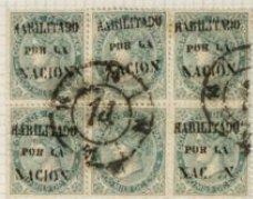
One stamp without opt. 'RDC' 14. Aut. Graus.