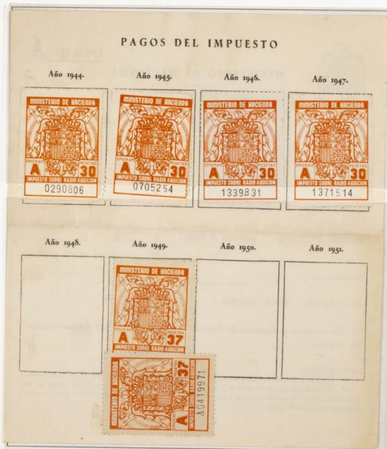
Impuesto sobre la Radioaudición. Documento fechado el 20 de Enero de 1944. Contiene cuatro sellos de 30 Ptas años 1944 al 1947 y dos de 37 Ptas correspondientes al año 1949 y al pago no satisfecho de 1948. En el dorso del sello correspondiente a 1948 figura la fecha escrita a mano.