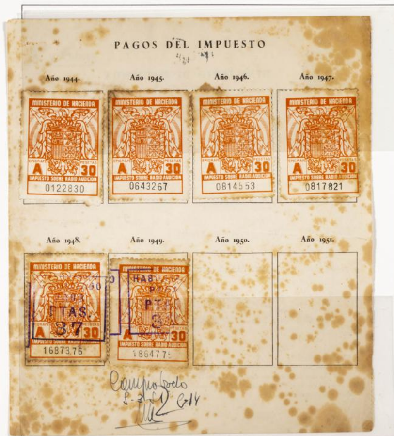
Impuesto sobre Radioaudición. Documento fechado el 1 de Enero de 1944. Contiene cuatro sellos de 30 Pts serie A de los años 1944 al 47 y dos de 30 Pts. Habilitados para 37 Pts. para los años 1948 y 49