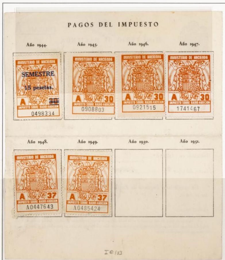
Impuesto sobre Radioaudición. Documento fechado el 9 Agosto de 1944. Contiene tres sellos de 30 Pts serie A de los años 1945 al 47 y uno de 30 Pts. Habilitados para 2º semestre 1944 y dos de 37 pts. para los años 1948 y 49