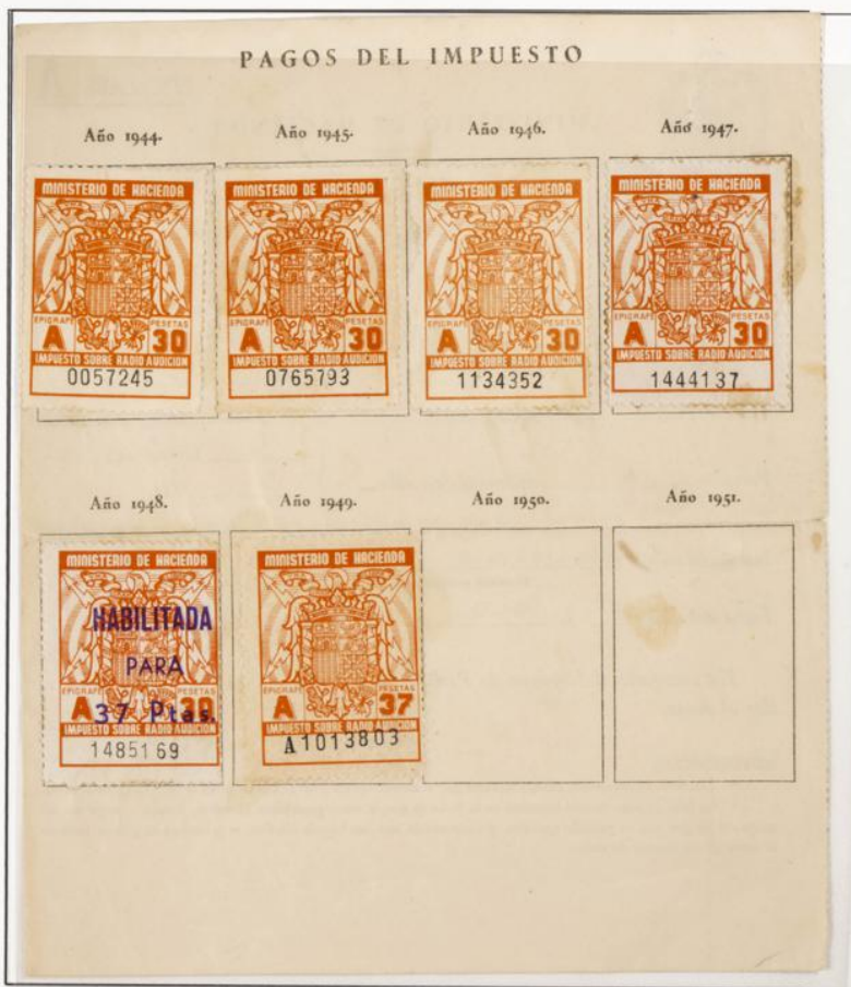
Impuesto sobre Radioaudición. Documento fechado el 27 Enero de 1944. Contiene cuatro sellos de 30 Pts serie A de los años 1944 al 47 y uno de 30 Pts. Habilitados para 37 Pts. y uno de 37 pts. para el año 1949