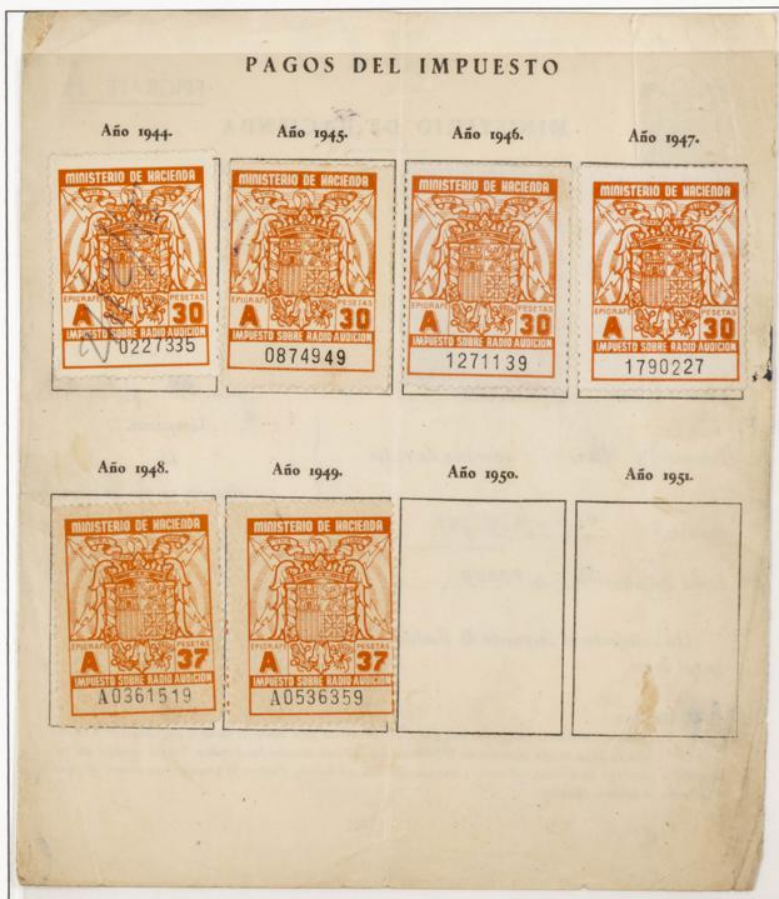
Impuesto sobre Radioaudición. Documento fechado el 31 Enero de 1944. Contiene cuatro sellos de 30 Ptas serie A de los años 1944 al 47 y dos de 37 Ptas. para el año 1948 y 49