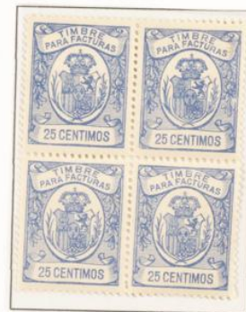
Dentado 11 ½