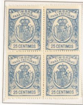
Dentado 13 ½

Se llo para facturas y recibos. Corona Real en un óvalo. Leyenda Timbre para facturas en la parte superior y valor en la inferior. En los laterales corona de laureles. en rojo. Dentado 13 ½