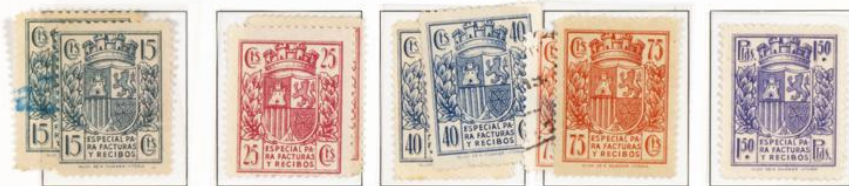
Fragmento utilizado por Correo