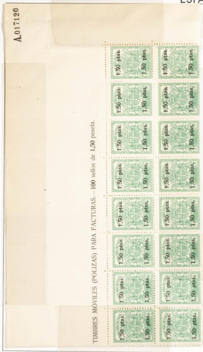
Bloque de 20 sellos sin numeración en el reverso. Cabeecera de pliego. Dentado 11 1/2. Número A.017120.

1932 - 36.- Timbre para facturas y recibos. Impresos en litografía. Dentado 11 1/2.