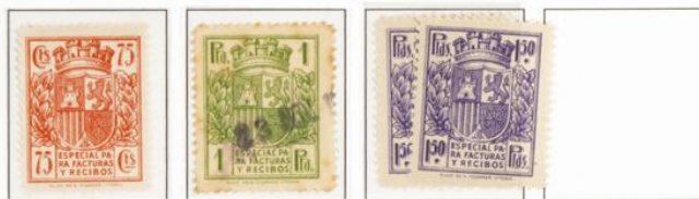
Cambios en las tonalidades de color