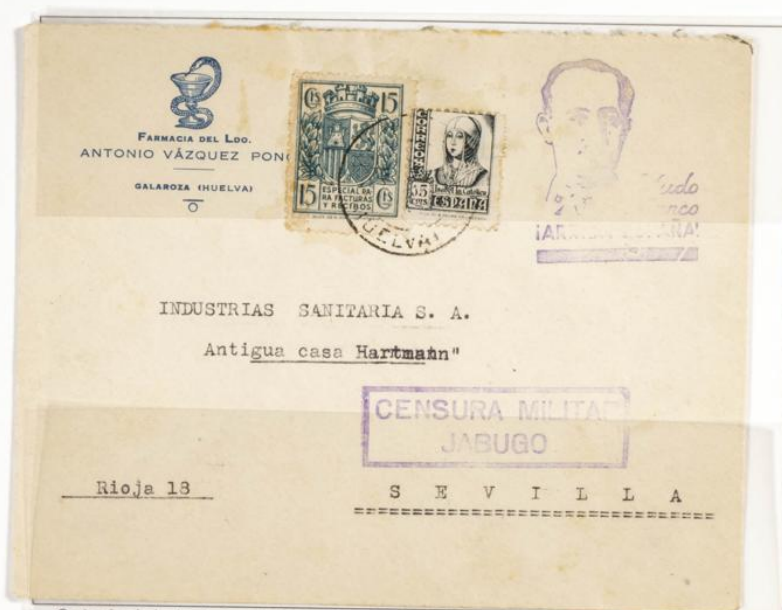
Carta circulada desde Cazorta Huelva a Sevilla. Matasellos de salida con fecha ilegible y llegada a Sevilla en Marzo de 1938. Censura militar de Jabugo. Sello fiscal especial facturas y recibos de 15 cts verde.

1937.- Timbre para facturas. Escudo con corona mural. Impreso en Litografía. Pie de imprenta "HIJOS DE H. FOURNIER VITORIA." Dentado 10 ¼ - 11 ½.