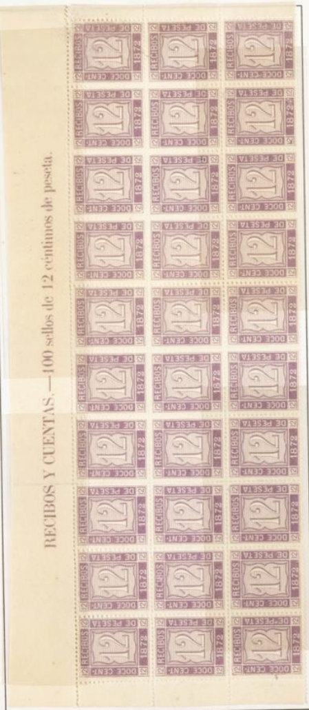
RECIBOS Y CUENTAS.—100 sellos de 12 céntimos de peseta.