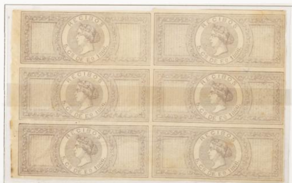
Precioso bloque de seis con goma original. Raro en Bloque.