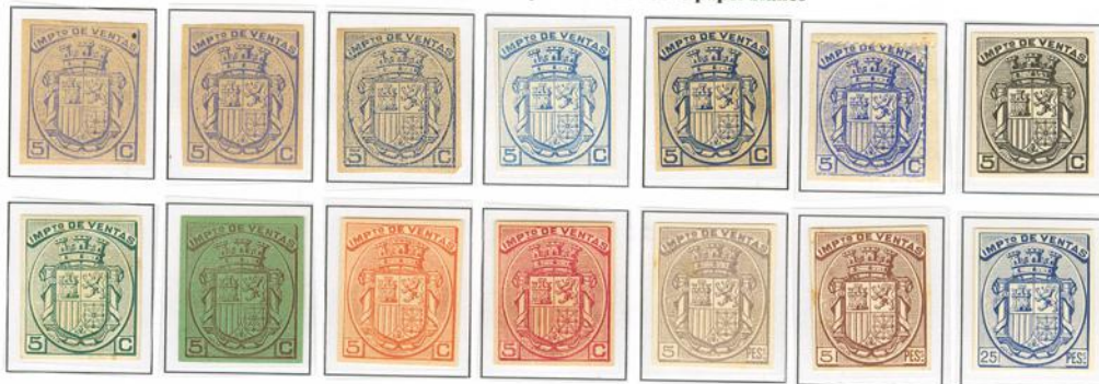
Ensayos pruebas dentados y sin dentar sobre papel blanco

Escudo de España, sobremontado por Corona Mural, ocupa el centro de un óvalo, en la parte superior la inscripción Imp o de Ventas y en la inferior la indicativa de su valor. Grabador Eugenio Juliá.