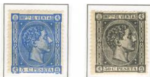
Diferentes Tonalidades de color

1º de Febrero 1877 hasta 11 de Junio de 1877. Efigie de Alfonso XII conteniendo inscripciones Impt o ventas en la parte superior y valor en la inferior. Grabador Eugenio Juliá. Dent. 14.