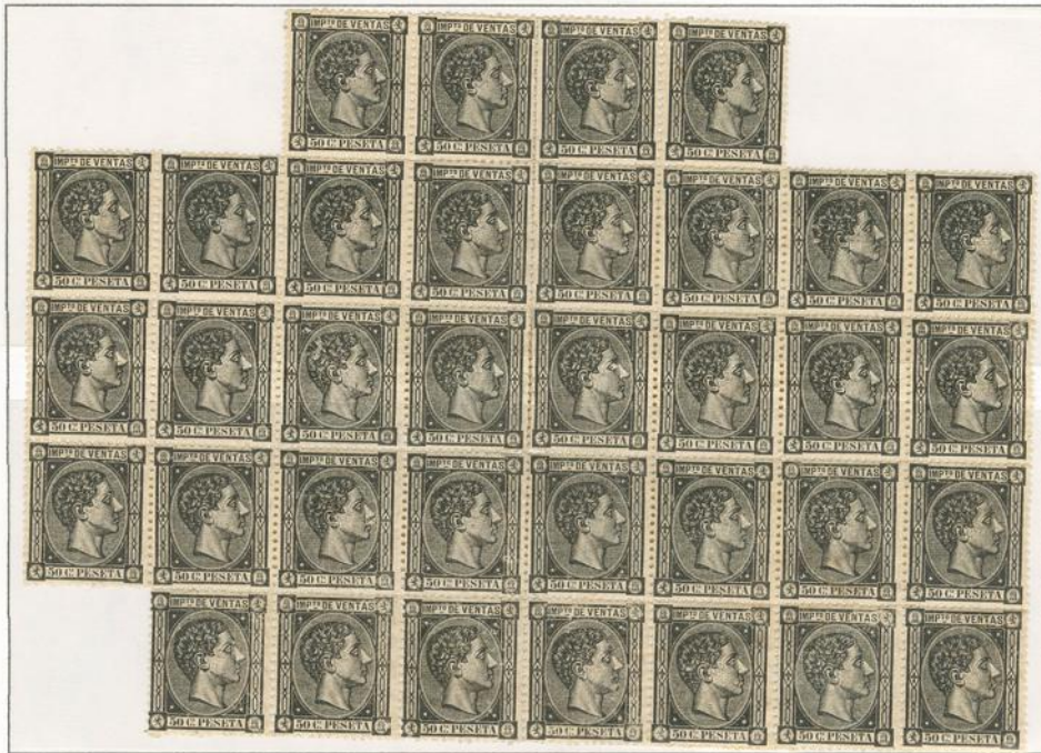
Bloque de 35 sellos.