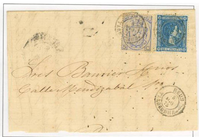
Carta circulada de Reus a Barcelona. Fechador de entrada de Reus Tarragona. El sello de Impuesto de ventas se utilizó en sustitución del sello de Impuesto de guerra.

Escudo de España, sobremontado por Corona Mural, ocupa el centro de un óvalo, en la parte superior la inscripción Impt° de ventas y en la inferior la indicativa de su valor. Grabador Eugenio Juliá.