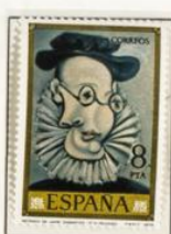
Retrato de Jaime Sabartés