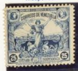
Visto de Caracas y Libertad