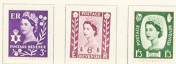
Irlanda del Norte