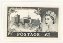
Castillo de Windsor

1958-59.—Sellos precedentes con una o dos barras negras verticales en el dorso