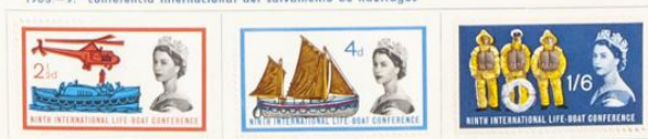
Helicóptero y barca