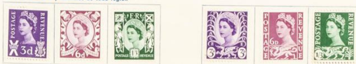
Gales y Manouthshire

1958.—Isabel II y símbolos de cada región