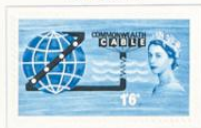
Isabel II, esfera y cable