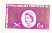
Arco Interior de Westminster