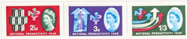
Alegorías de la marcha ascendente de la producción