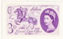
Postilón • Isabel II

1960.—Tercer Centenario de la Oficina General de Correos