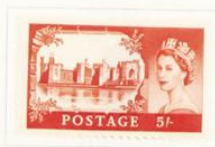
Castillo de Carnarvon