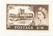
Castillo de Carrickfergus