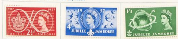
Isabel II e insignia scoutista

1957.—Dedicados al fundador de los Boy-Scouts