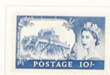
Castillo de Edimburgo