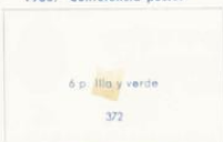
Isabel II y alegorías