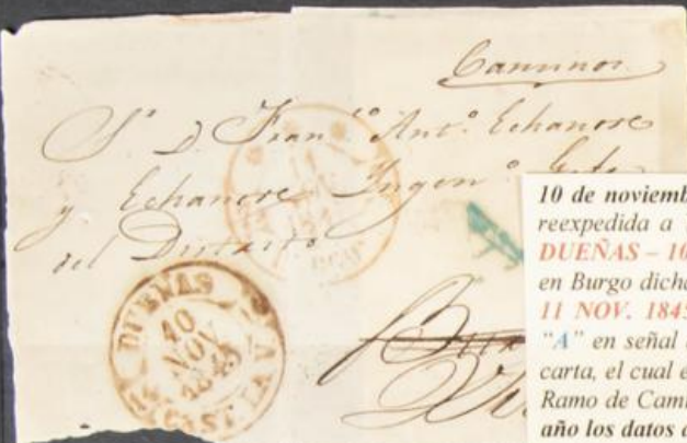
10 de noviembre de 1845. Carta circulada de Dueñas a Burgos y reexpedida a Vitoria. Marca de origen timbre de fecha de 1842, DUEÑAS - 10 NOV. 1845 - CAST. LA V. . Al reexpedirse la carta en Burgo dicha administración estampa su timbre, TIPO II, ****- 11 NOV. 1845 - BURGOS . Marca de abono inédita de Dueñas "A" en señal de franquicia debido al cargo del destinatario de la carta, el cual está exento del pago del porte debido a su cargo en el Ramo de Caminos. El uso de este fechador en 1845 adelanta en 1 año los datos de su utilización actualmente catalogados.