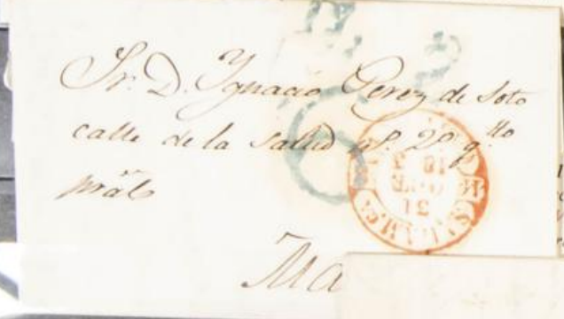
1843. Carta circulada de Salamanca a Madrid. fechador de 1842, TIPO I, SALAM. CS - 31 OCT. 1843. Porteo 6 cuartos en cuño fechador de Madrid, para la carta de peso de menos de 6 adarmes en