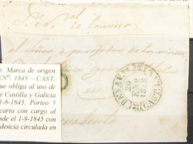
20 de enero de 1845. Carta circulada en Benavente. Marca de origen timbre de fecha de 1842, TIPO I, BENAV. 20 ENO. 1845 - CAST. LA V. , color verde, en aplicación de la normativa que obliga al uso de este color para las administraciones de la carrera de Castilla y Galicia incluyendo Asturias desde el 1-7-1844 hasta el 31-8-1845. Porteo 5 cuartos de Benavente, acorde a la tarifa para la carta con cargo al destinatario de peso de hasta 6 adarmes en vigor desde el 1-9-1845 con validez hasta el 31-10-1854, aplicada a la correspondencia circulada en la demarcación postal CASTILLA LA VIEJA.