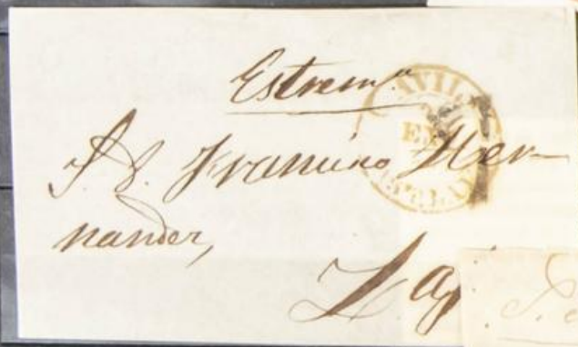
Carta circulada de Ávila a Zafra. Marca de origen 1842, AVILA - 20 ENO. 1845 - CAST. LA V. , color de la normativa que obliga al uso de este color de las administraciones de la carrera de Castilla y Galicia incluyendo Asturias desde el 1-7-1844 hasta el 31-8-1845. Porteo 7 cuartos, acorde a la tarifa de 1842 hasta el 31-8-1845.