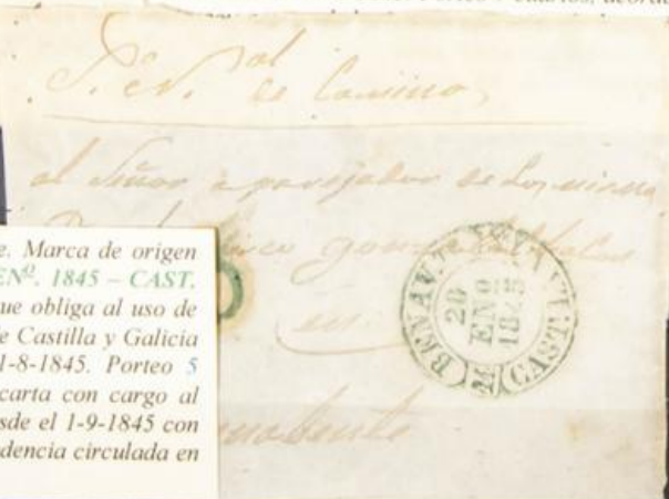
20 de enero de 1845. Carta circulada en Benavente. Marca de origen timbre de fecha de 1842, TIPO I, BENAV. 20 ENO. 1845 - CAST. LA V. , color verde, en aplicación de la normativa que obliga al uso de este color para las administraciones de la carrera de Castilla y Galicia incluyendo Asturias desde el 1-7-1844 hasta el 31-8-1845. Porteo 5 cuartos de Benavente, acorde a la tarifa para la carta con cargo al destinatario de peso de hasta 6 adarmes en vigor desde el 1-9-1845 con validez hasta el 31-10-1854, aplicada a la correspondencia circulada en la demarcación postal CASTILLA LA VIEJA.