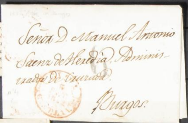
5 de septiembre de 1842. Carta circulada de Ávila de origen fechador de 1842, AVILA - 5 SET. 1842 . Porteo 6 cuartos estampado en Burgos, acorde a de peso de menos de 6 adarmes en vigor desde validez hasta el 31-8-1845, aplicada a la corres entre las demarcaciones postales de CASTILLA L.