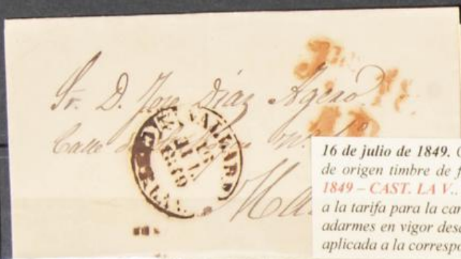
16 de julio de 1849. Carta circulada de Valladolid a Madrid. Marca de origen timbre de fecha de 1842, TIPO I, VALLAD. D - 16 JUL. 1849 - CAST. LA V.. Porteo 1R en cuño fechador de Madrid, acorde a la tarifa para la carta con cargo al destinatario de peso de hasta 6 adarmes en vigor desde el 1-9-1845 con validez hasta el 31-10-1854, aplicada a la correspondencia circulada en España.