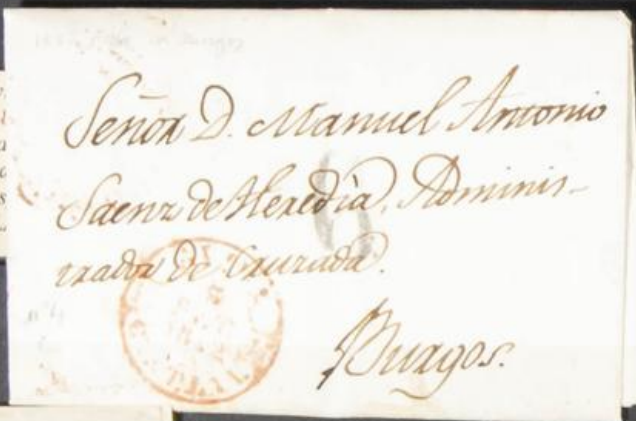
5 de septiembre de 1842. Carta circulada de Ávila de origen fechador de 1842, AVILA - 5 SET. 1842 . Porteo 6 cuartos estampado en Burgos, acorde a de peso de menos de 6 adarmes en vigor desde validez hasta el 31-8-1845, aplicada a la corres entre las demarcaciones postales de CASTILLA L.