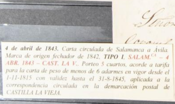
4 de abril de 1843. Carta circulada de Salamanca a Avila. Marca de origen fechador de 1842, TIPO I, SALAM. CS - 4 ABR. 1843 - CAST. LA V.. Porteo 5 cuartos, acorde a tarifa para la carta de peso de menos de 6 adarmes en vigor desde el 1-11-1815 con validez hasta el 31-8-1845, aplicada a la correspondencia circulada en la demarcación postal de CASTILLA LA VIEJA.