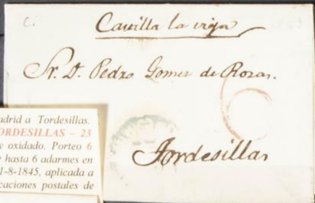
23 de diciembre de 1843. Carta circulada de Madrid a Tordesillas. Marca de llegada timbre de fecha de 1842, TORDESILLAS - 23 DIC. 1843 - CAST. LA V., en color rojo muy oxidado. Porteo 6 cuartos, acorde a tarifa para la carta de peso de hasta 6 adarmes en vigor desde el 1-11-1815 con validez hasta el 31-8-1845, aplicada a la correspondencia circulada entre las demarcaciones postales de