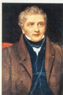
John Walter II was the founding father of the role of the press as a fourth estate of the realm. His great editor was the young Thomas Barnes. The Lord Chancellor said: "Barnes is the most powerful man in the country"