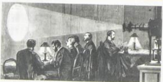
In 1870 during the Franco-Prussian War, the Siege of Paris cut communications for The Times. Above: dispatches and personal advertisements for the Agency Column were flown out by balloons. Below: microscopically reduced messages were carried in and out by pigeons, and magnified by electric light