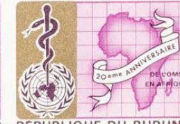
REPUBLIQUE DU BURUNDI