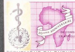
REPUBLIQUE DU BURUNDI