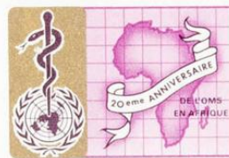
REPUBLIQUE DU BURUNDI