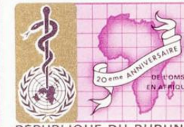
REPUBLIQUE DU BURUNDI