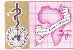
REPUBLIQUE DU BURUNDI