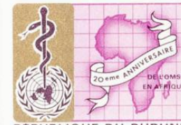
REPUBLIQUE DU BURUNDI