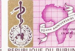
REPUBLIQUE DU BURUNDI