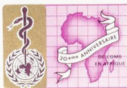
REPUBLIQUE DU BURUNDI