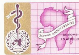
REPUBLIQUE DU BURUNDI