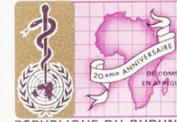
REPUBLIQUE DU BURUNDI