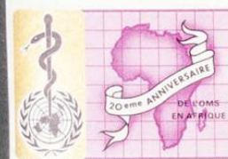
REPUBLIQUE DU BURUNDI