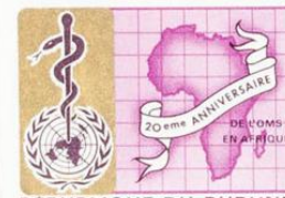
REPUBLIQUE DU BURUNDI