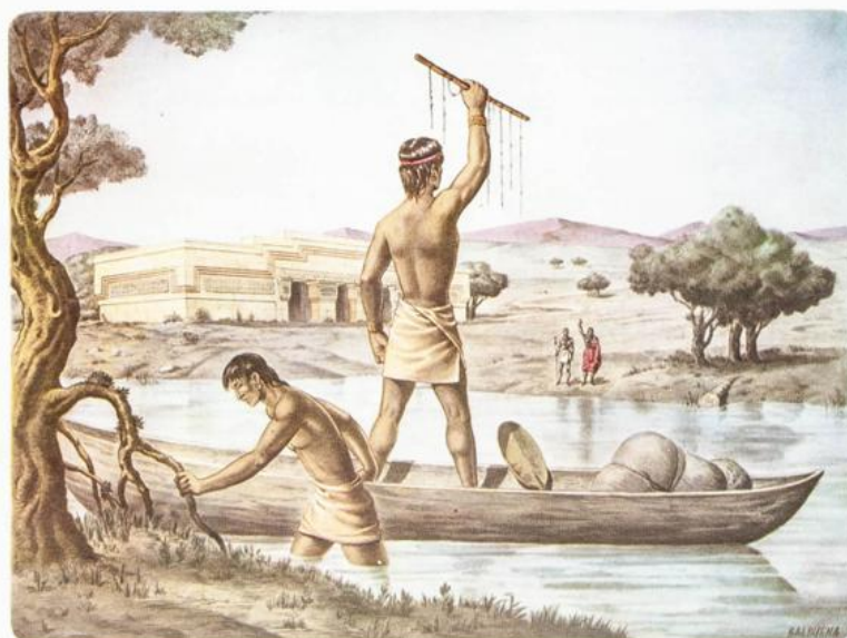
Portador de «gripas» en Mexico, 1590, por Balbuena.

Depósito legal: M. 9.783-1958 - ISSN: 0210-2.803