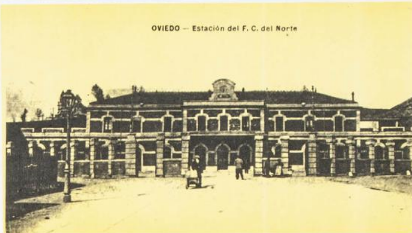
OVIEDO — Estación del F. C. del Norte