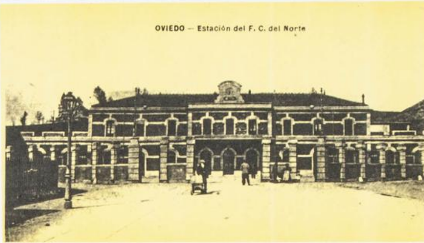
OVIEDO — Estación del F. C. del Norte