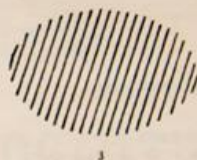
Tipo 3. Negro. Verde.