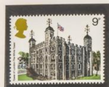
1978 - PALACIOS Y CASTILLOS