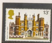
1978 - EXPOSICION FILATELICA «LONDON 1980»