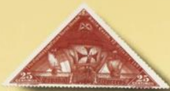
Las tres carabelas hacia el Nuevo Mundo. 1930.