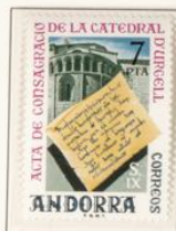
1975 — Festival literario