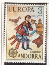
1975 — Europa