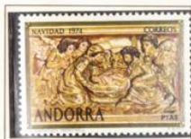
1974 — Navidad