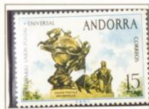
1974 — Centenario de la U.P.U.