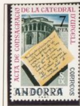
1975 — Festival literario