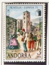
1975 — Exposición Mundial de Filatelia "ESPAÑA 75"