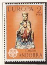
1974 — Europa