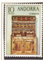
1974 — Artesanía