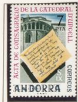
1975 — Festival literario