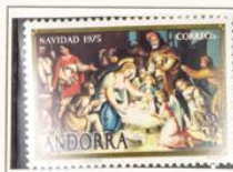
1975 — Navidad