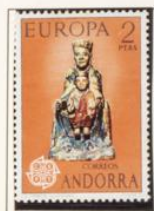
1974 — Europa