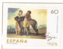
1996 - CCL Aniversario del nacimiento de Francisco de Goya