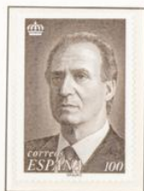
1996 - Juan Carlos I