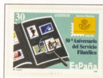
1996 - L Aniversario del Servicio Filatélico de Correos