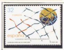
Logros Deportiv. Españoles