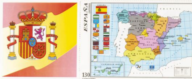
Mapa Oficial del Estado Autonómico