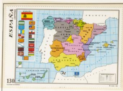
1996 - Mapa oficial del Estado Autonómico