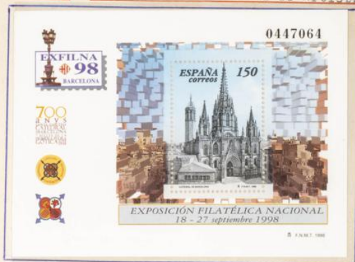
EXFILNA. Barcelona. H.B. Prueba de Artista