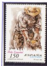
Arte Español I