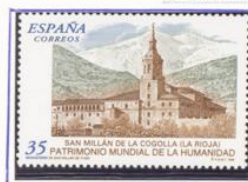
Patrimonio de la Humanidad