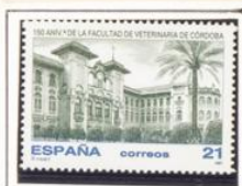
Facul. Veter. Córdoba