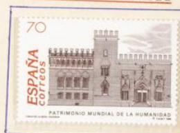
Lonja de Valencia