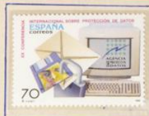
XX.Confª Intern. sobre Prote.Datos