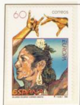
1996 - Europa