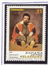
400 Años nac. Velázquez