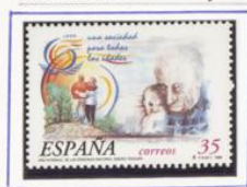
Año Intern. Personas Mayores