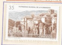
Casco Antiguo Cuenca