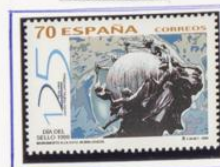
Día del sello