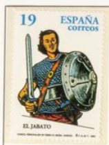
1996 - Cómics españoles