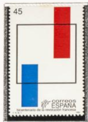
Alegoría del triunfo de la razón y bandera francesa.

1989.-Bicentenario de la Revolución francesa.