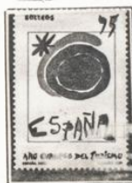
Simbolo del turismo, creado por Joan Miró