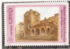
Centro histórico de Cáceres. Torre de Bujaco.