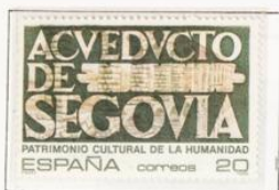
La Ciudad vieja de Segovia y su acueducto.