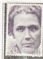
Victoria Kent, 1898-1987.

1990.-Exposición Universal de Sevilla. Expo '92.