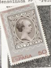
Sello de Alfonso XIII de 1889.

1989.-Centenario de la 1ª emisión de Alfonso XIII, denominada de "Pelón".