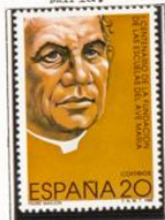
El padre Andrés Manjón, Fundador