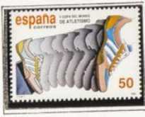
Iniciación de la carrera.

1989.-Centenario de la 1ª emisión de Alfonso XIII, denominada de "Pelón".