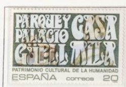
Parque y Palacio de Güell y Casa Milà, Barcelona.