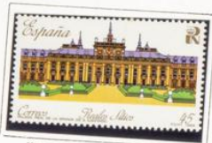
Monasterio de San Lorenzo del Escorial.