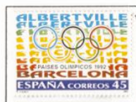
1992 - Países Olímpicos