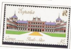
Palacio Real de la Granja de San Ildefonso.