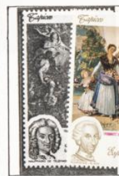
Nafragio de Telémaco.