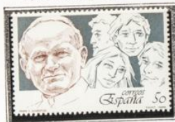
El Papa y grupo de jóvenes.

1989.-Barcelona'92. III Seria Pre-Olimpica.