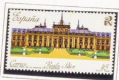
Monasterio de San Lorenzo del Escorial.