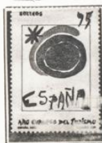
Símbolo del turismo, creado por Joan Miró