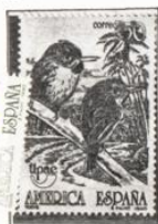
Toda ave cornu-eiforme.