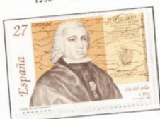
1992 - Día del Sello