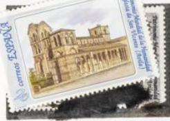
Casco viejo de Avila. Iglesias de extramuros. San Vicente (Avila).