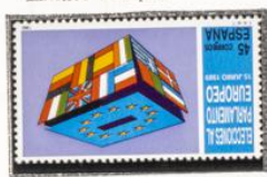
Urna electoral y Bandera.