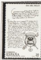
1º Convenio Internacional y escudo