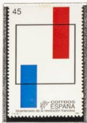
Alegoría del triunfo de la razón y bandera francesa.

1989.-Bicentenario de la Revolución francesa.