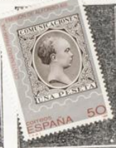
Sello de Alfonso XIII de 1889.

1989.-Centenario de la 1ª emisión de Alfonso XIII, denominada de "Pelón".