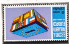
Urna electoral y Bandera.