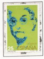
1991 - Mujeres famosas españolas Maria Moliner