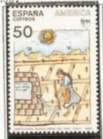
Ilustración del manuscrito: "Nueva crónica y buen gobierno".

1989.-América-UPAE. Pueblos precolombinos.