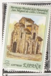
Iglesia prerrománica. S. Miguel de Lillo. Oviedo.