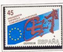
Bandera, diseño de Tapies.

1989.- Presidencia española de las Comunidades Europeas