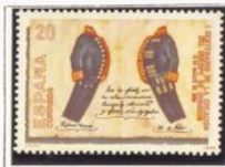
Uniforme de Gala y de diario.

1989.-I Cent. de la creación del Cuerpo de Correos.