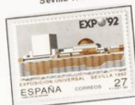
1992 - Exposición Universal Sevilla 1992