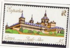
Palacio Real de Aranjuez.