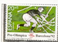
Hockey sobre hielo.