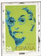
1991 - Mujeres famosas españolas Maria Moliner