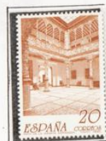
Patio de la Infanta. Zaragoza.

1990.-Exposición Filatélica Temática, Pilatam '90, Palencia.