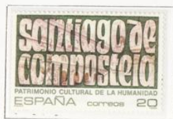
Ciudad de Santiago de Compostela, La Coruña.