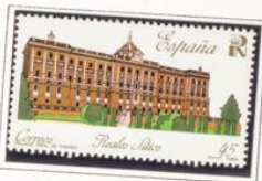
Palacio Real de Madrid.

1990.-Campeonato del Mundo de ciclo-cross Getxo '90