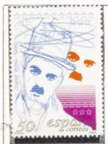
Charlie Chaplin. Charlot.