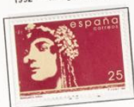
1992 - Margarita Xirgu