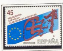
Bandera, diseño de Tapies.

1989.- Presidencia española de las Comunidades Europeas