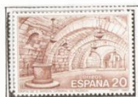
Cripta de San Antolín.

1990.-Exposición Filatélica Temática, Pilatam '90, Palencia.