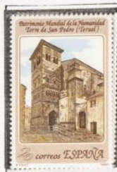
Arquitectura mudéjar de Teruel. Torre de San Pedro.