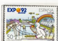
"CURNO", Mascota de la Expo '92 visitando diversos lugares del recinto.

1990.-Barcelona '92. IV Serie Pre-Olimpica.