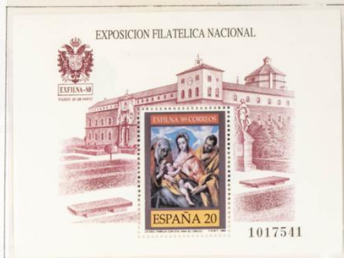
"Sagrada Familia" de El Greco.