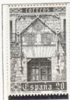
Fachada de la Casa.

1989.- Presidencia española de las Comunidades Europeas