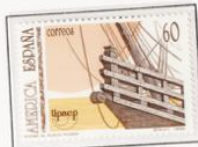
1992 - América UPAEP