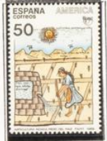
Ilustración del manuscrito: "Nueva crónica y buen gobierno".

1989.-América-UPAE. Pueblos precolombinos.