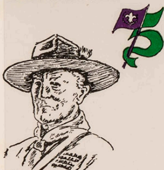
Lord, Baden Powell

EXPOSICION FILATELICA REGIONAL 75 ANIVERSARIO MOVIMIENTO SCOUT LA LINEA 27 MARZO / 3 ABRIL