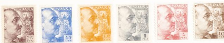
(Lugar 24 del bloque reporte)