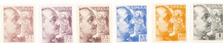
(Lugar 13 del bloque reporte)