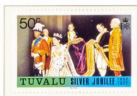
Die Königin bei der Krönung.