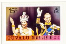
Königin Elisabeth II. und der Herzog von Edinburgh auf dem Balkon vom Buckingham-Palast nach der Krönung.

Kronkolonie im Stillen Ozean, ehem. Ellice-Inseln, seit 1976 von Gilbert-Inselgruppe unabhängig; Hauptort: Funafuti; 10 000 Einw.; Wäbrg.: 1 Austr.-Dollar = 100 Cents.