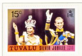
Königin Elisabeth II. und der Herzog von Edinburgh auf dem Balkon vom Buckingham-Palast nach der Krönung.

Kronkolonie im Stillen Ozean, ehem. Ellice-Inseln, seit 1976 von Gilbert-Inselgruppe unabhängig; Hauptins. Funafute; 10 000 Einw.; Wäbrg.: 1 Austr.-Dollar = 100 Cents.