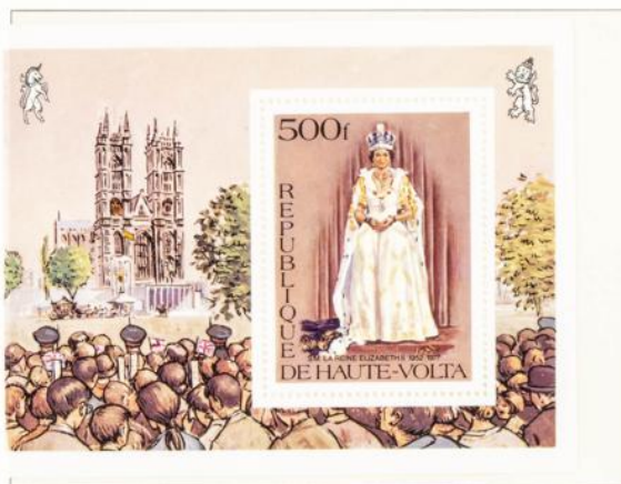
Die Königin im Staatsgewand aus reiner Seide, mit Staatskrone, dazu Hermelin- umhang; aus der Serie Königsfotos 1953 nach Dorothy Wilding. Auf dem Blockrand die Menschenmenge beim Krönungsumzug; hinten die Krönungskutsche. Vor der Abtei ist der Annex zu sehen, oben links und rechts die Wappentiere — Einhorn und Löwe.