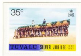
Der Herzog von Edinburgh im Staatskanu, getragen von Eingeborenen, bei seinem Besuch auf der Insel Tuvalu.