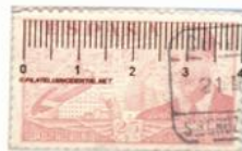
Dentado 10 ¼ Burgos Tamaño 39 x 23