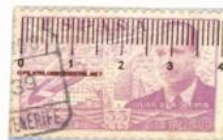
Dentado 10 ¼ Burgos Tamaño 39 x 23