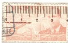
Dentado 10 ¼ Burgos Tamaño 39 x 23

Se trata de una carta certificada que a pesar de enviarse por correo convencional se franqueó con tres sellos de Juan de la Cierva de la emisión de Burgos año 1939. Los sellos son 20 Cts. Naranja (ED 880) puesto en circulación 4 Marzo 1939, 25 Cts. Rojo (ED 881) puesto en circulación 5 Febrero 1939, 35 Cts. Lila carminado (ED 882) puesto en circulación 5 Febrero 1939.