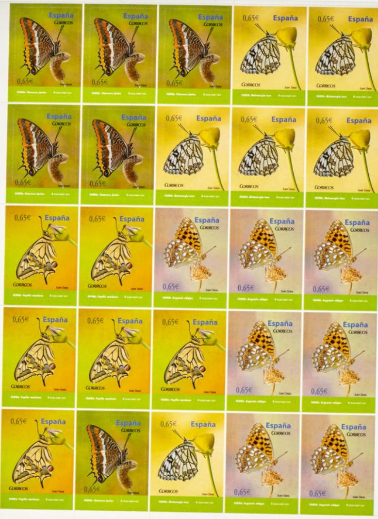
25 sellos adhesivos de correos de 0,65 €.—FAUNA.—Marriposas.—2011