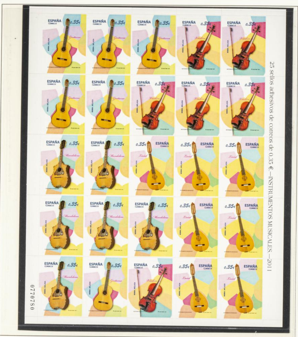
25 sellos adhesivos de correos de 0,35 €.—INSTRUMENTOS MUSICALES.—2011