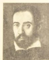
13. Retrato de Juan de Juanes, siglo XVI. Colección de la Biblioteca Nacional de Madrid.

La introducción del arte renacentista en Valencia tiene lugar en el siglo XVI, cuando se ven surgir, sucesivamente, estilos y tendencias que reflejan la evolución histórica, de carácter diverso, que experimenta el país. Contribuyen a ello, además, la influencia de las corrientes artísticas europeas y el contacto con las culturas de Oriente y Occidente. En el siglo XVI, la pintura española experimenta una gran actividad. Se ven surgir, sucesivamente, estilos y tendencias que reflejan la evolución histórica, de carácter diverso, que experimenta el país. Contribuyen a ello, además, la influencia de las corrientes artísticas europeas y el contacto con las culturas de Oriente y Occidente.